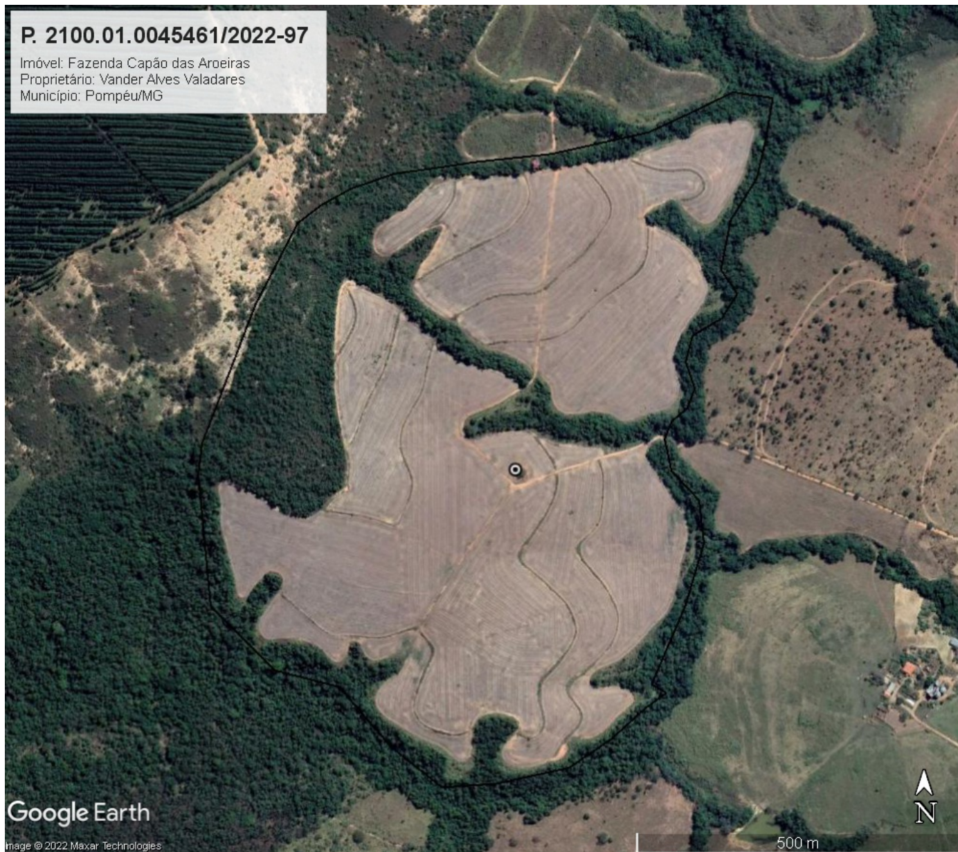
Figura 2: Imagem do Google Earth de 29/06/2022, evidenciando a Fazenda Capão das Aroeiras com base nos arquivos georreferenciados do Cadastro Ambiental Rural da Propriedade (polígono preto). Em evidência, a individuo a ser suprimido.

Figura 1: Recorte da Planta Topográfica apresentada pelo requerente evidenciando a área em que será realizada a intervenção ambiental que, segundo a planta, se encontra fora das áreas de preservação permanente e reserva legal do imóvel. Ponto Verde: árvore a ser suprimida.