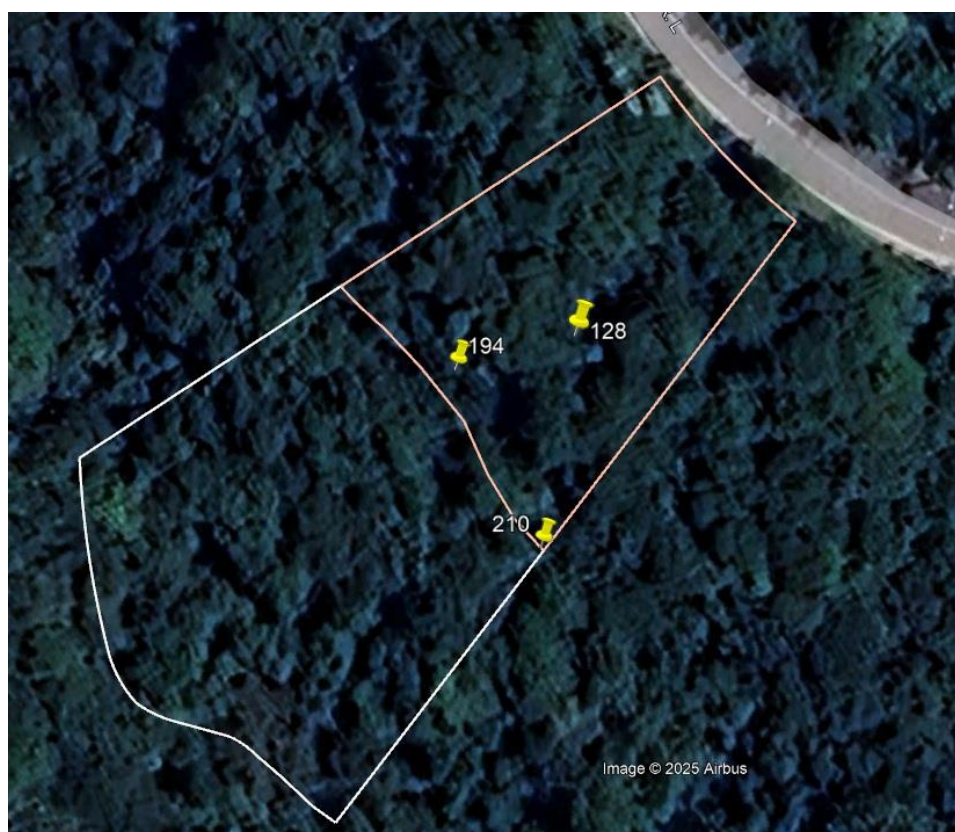
Figura: Localização dos espécimes de Stephanopodium engleri .