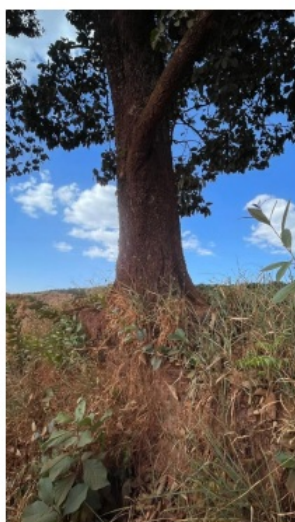
Figura 06 - Capitão-do-Campo.