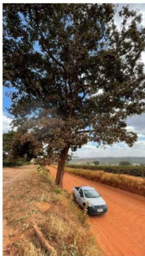
Figura 03 - Capitão-do-Campo inclinado sobre a via.