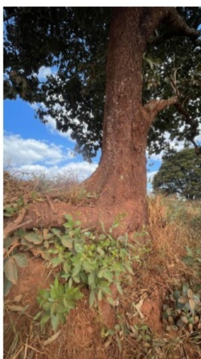
Figura 07 - Sistema radicular exposto.

Taxa de expediente : DAE nº1401364580764, valor recolhido de R$ 691,38, em 26/09/2025, conforme comprovante de pagamento (Doc. SEI nº 123975742 );