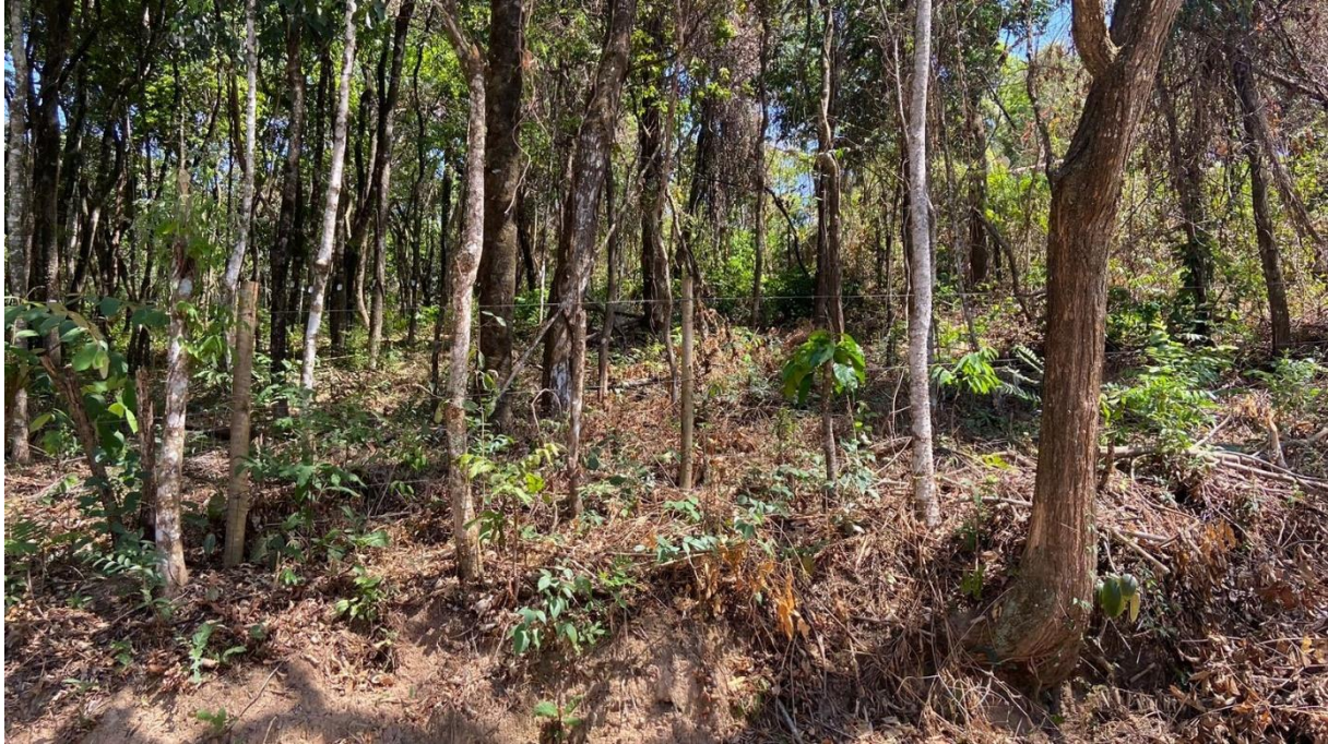
Imagens II, III e IV: interior do lote.