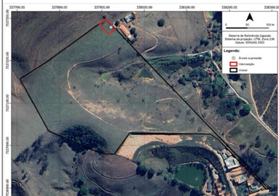
FIGURA 03: Imagem da propriedade Sítio Três Palmeiras, bairro Sapé, município de Jacutinga/MG, com a localização da árvore isolada nativa viva solicitada para corte e aproveitamento.