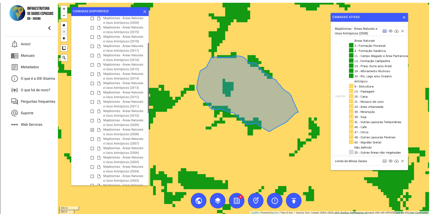
Figura 01 - Fonte: IDE-MG