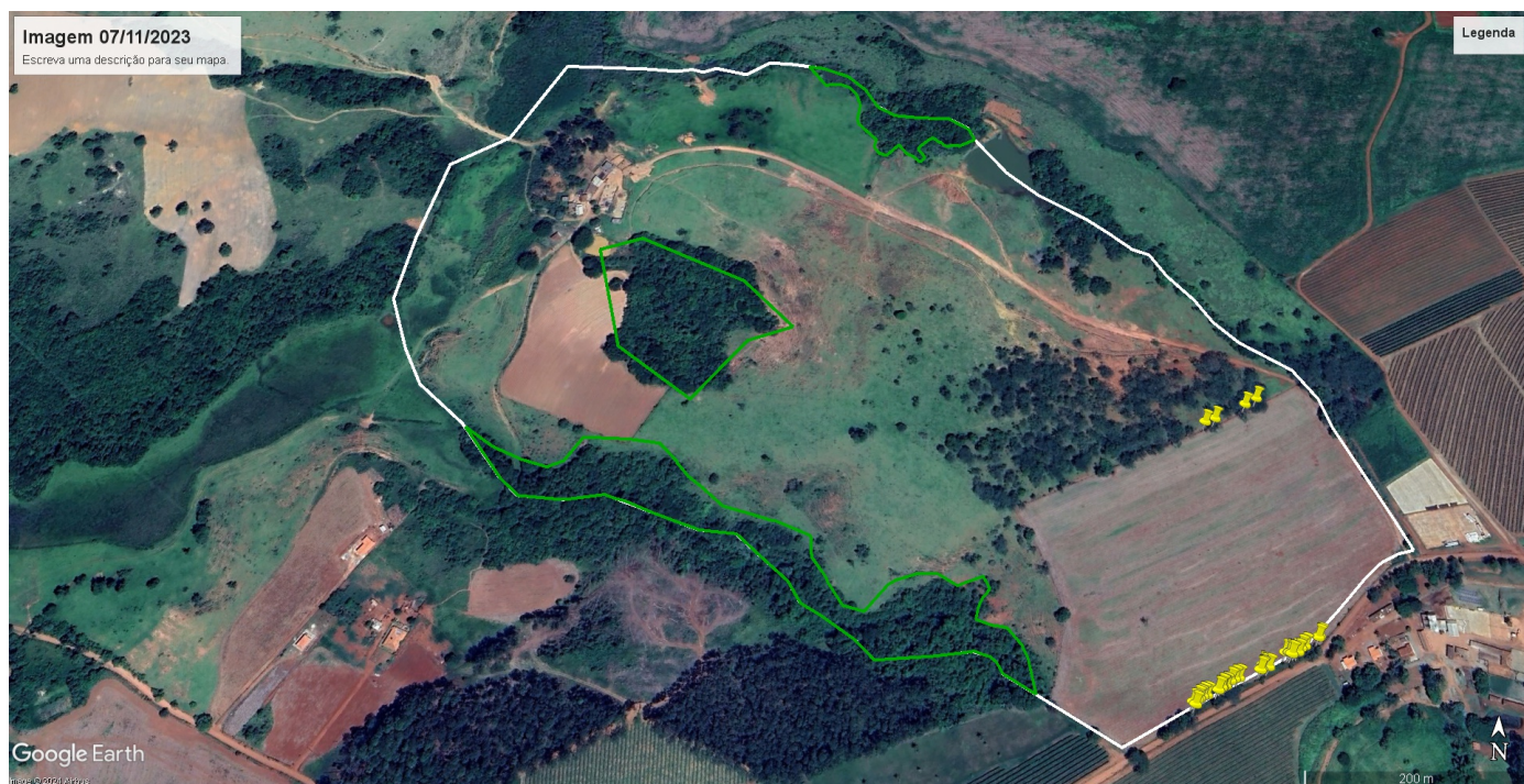
Imagem 02 - Fonte: Google Earth