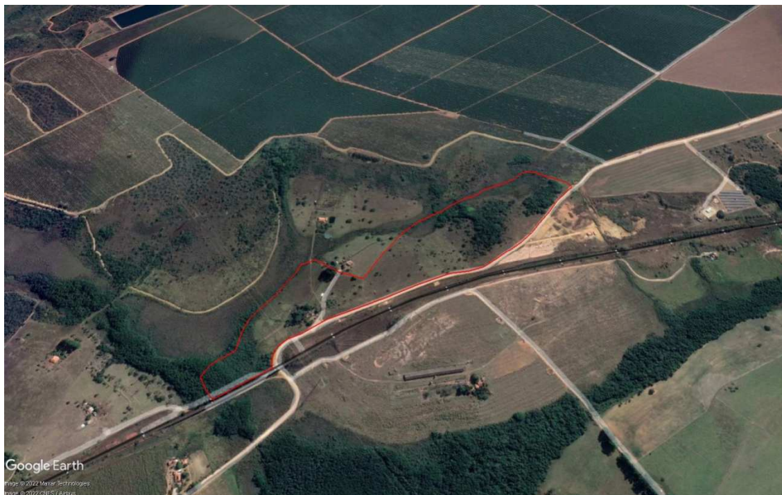
Figura 01: Vista aérea do empreendimento.