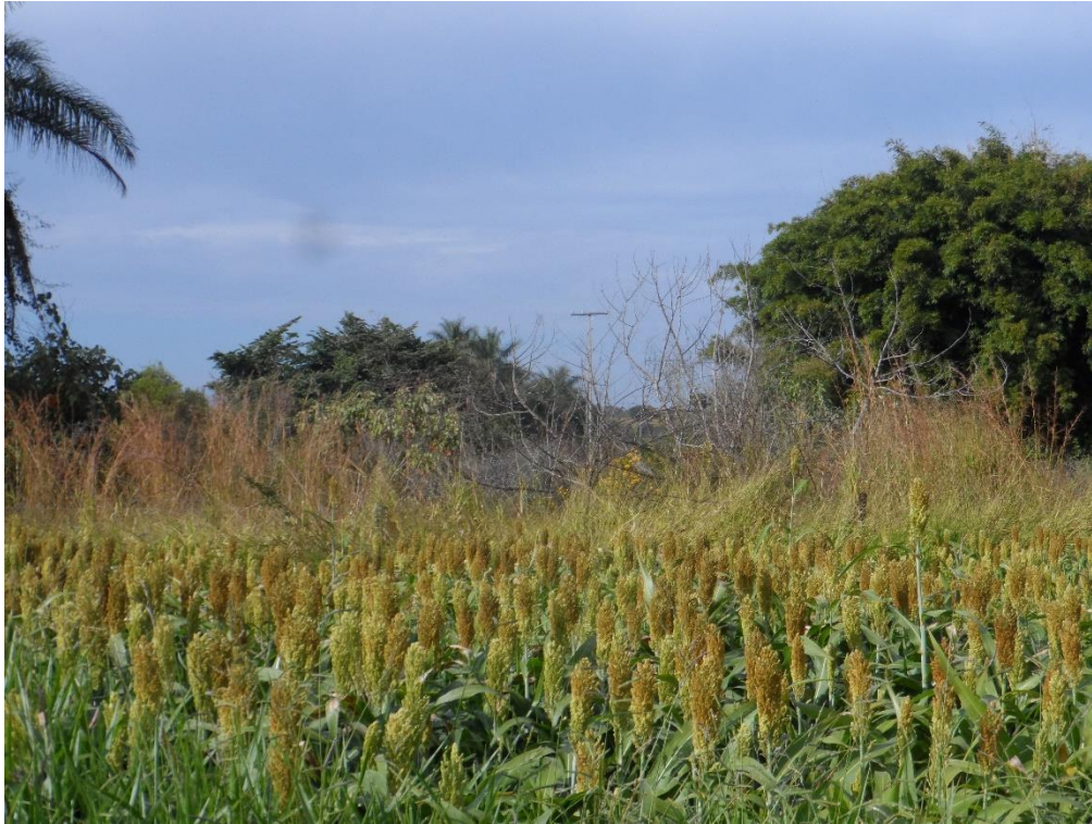
Figura 01: Local de passagem dos cabos de transmissão, poste ao fundo.