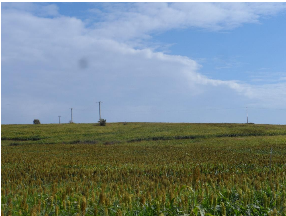
Figura 02: Local onde dará continuidade para passagem dos cabos. Área de lavoura.