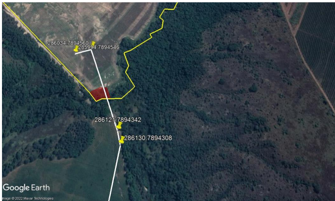
Figura 02: Em vermelho o local da intervenção, em branco onde será passada a linha de transmissão de acordo com o projeto da CEMIG, os pontos em amarelo os postes.