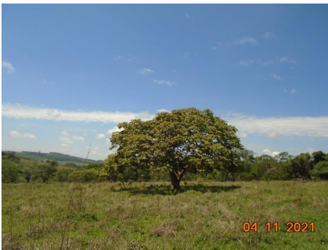
Figura 03: Vista árvores isoladas