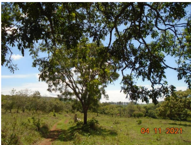
Figura 02: Vista árvores isoladas