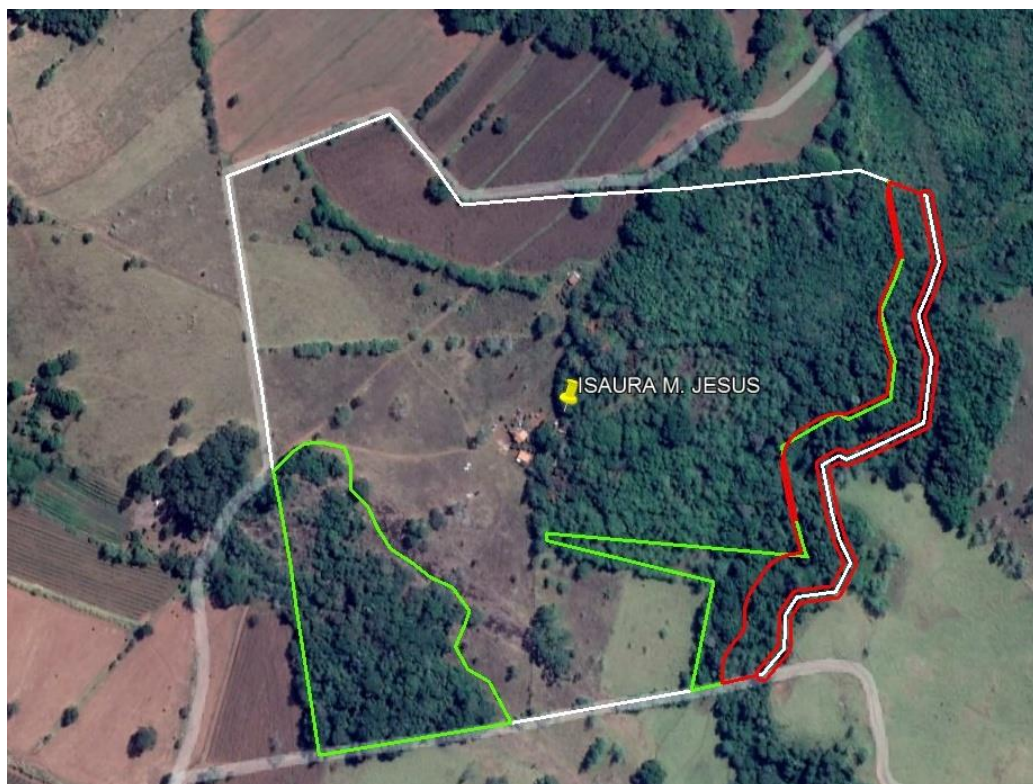
Figura 02: Áreas de reserva legal em destaque verde.

Verificou-se ainda que houve fragmentação da reserva legal, conforme imagem abaixo: