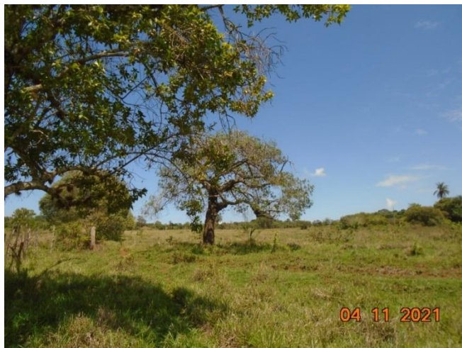
Figura 01: Vista árvores isoladas