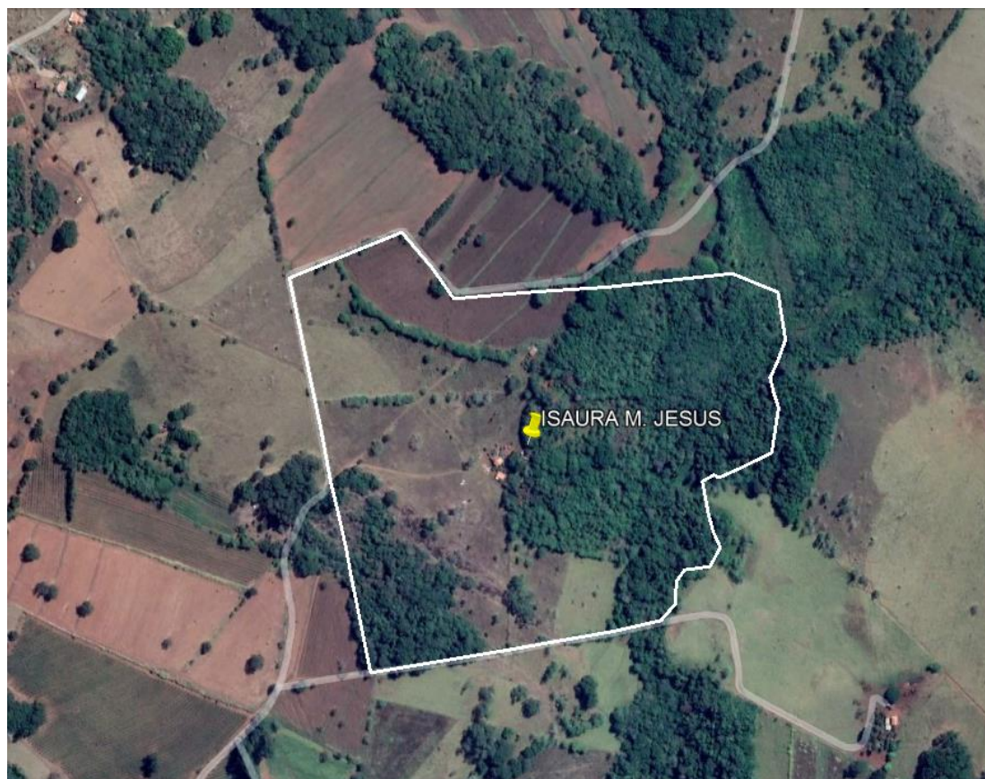
Figura 01: Vista aérea do empreendimento.

Os limites aproximados da propriedade estão representados na Figura 01: