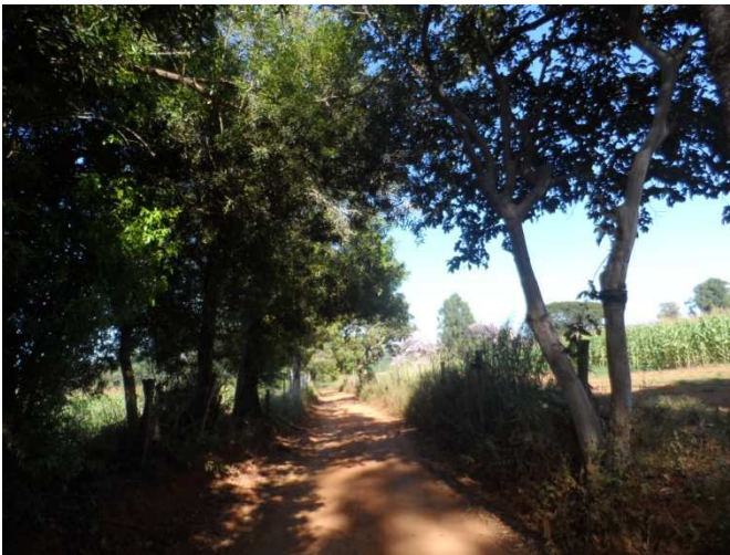
Figura 03: Estrada com árvores para supressão