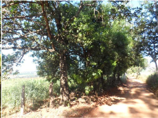
Figura 02: Estrada PTC-Comunidade Martins