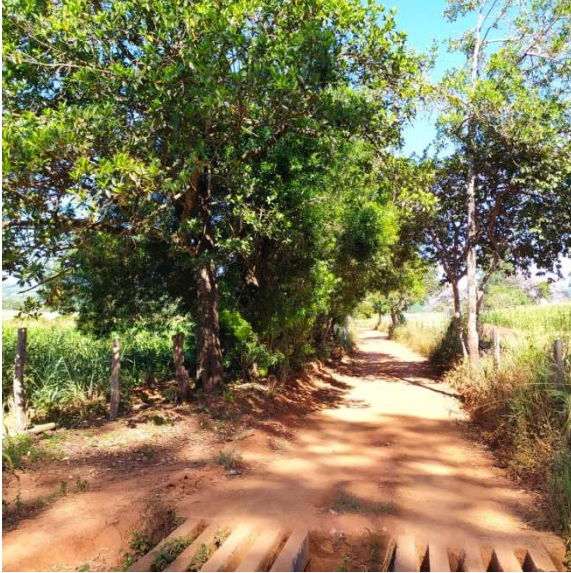
Figura 01: Vista da estrada