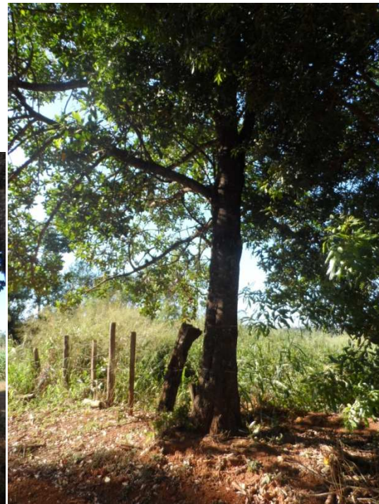
Figura 04: Indivíduo arbóreo a ser suprimido