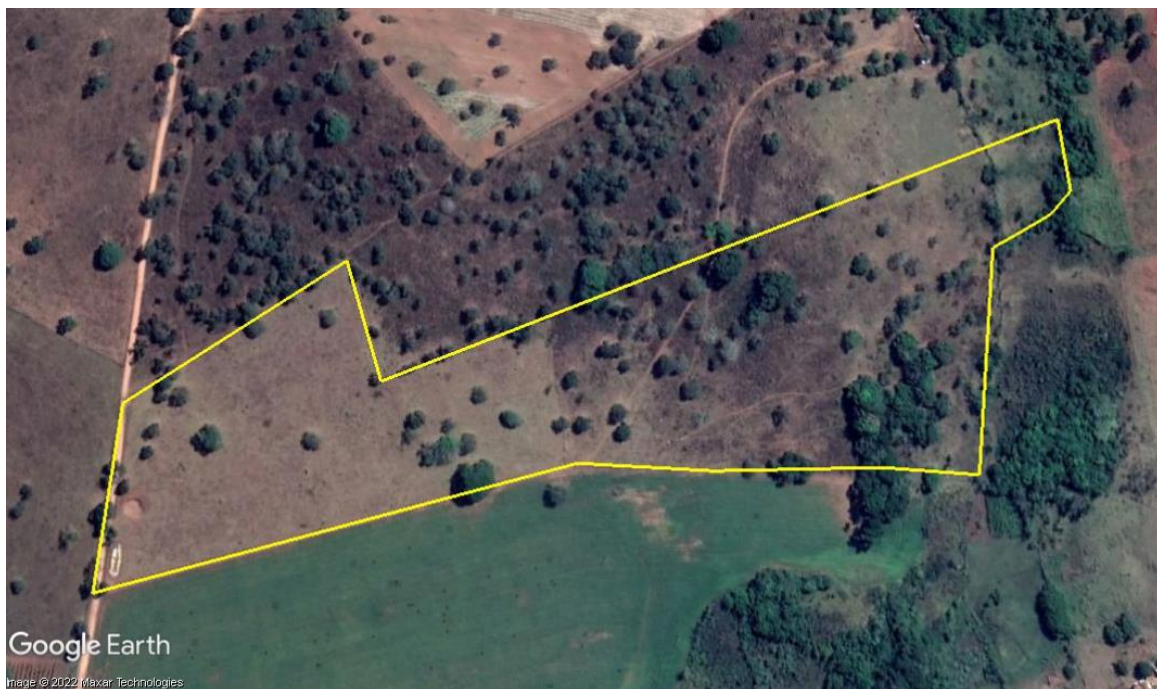
Figura 01: Vista aérea do empreendimento.

O empreendimento Fazenda Serra Negra – Matrícula 67.404 e 2.806, localizada na zona rural do município de Patrocínio-MG, tendo como pontos de referência as coordenadas projetadas no formato UTM, zona 23S: X: 309.906 e Y: 7.915.690, datum WGS84.