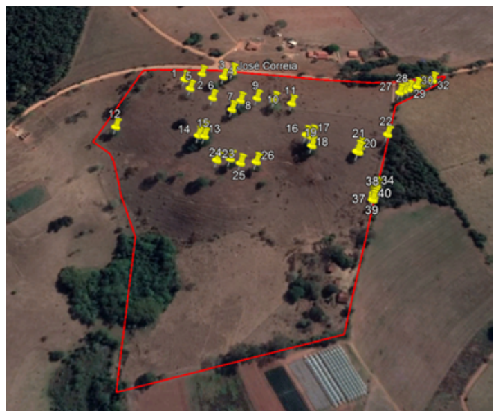
Figura 01: Localização das 40 árvores requeridas (marcadores em amarelo).