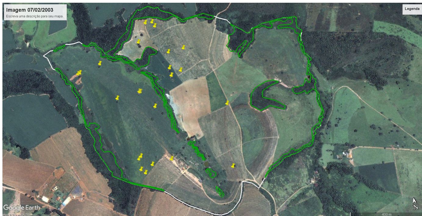
Imagem 01