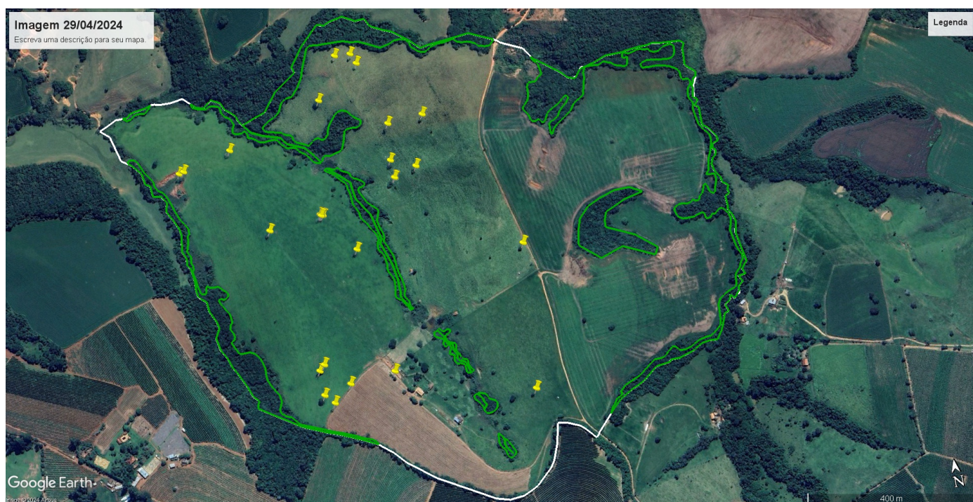
Imagem 02