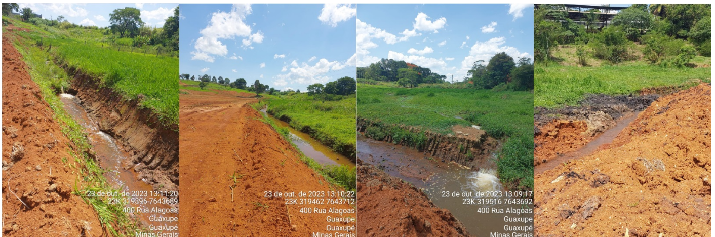
Foto 2. Pontos de alteração do traçado original de dois córregos que se uniam e derivavam um terceiro córrego que também teve seu traçado original alterado.

Desta maneira, a empresa responsável pela instalação do loteamento incorreu no código 309 (B) do Anexo III, Art. 112 do DECRETO Nº 47.383, DE 02 DE MARÇO DE 2018, estando passível de autuação.