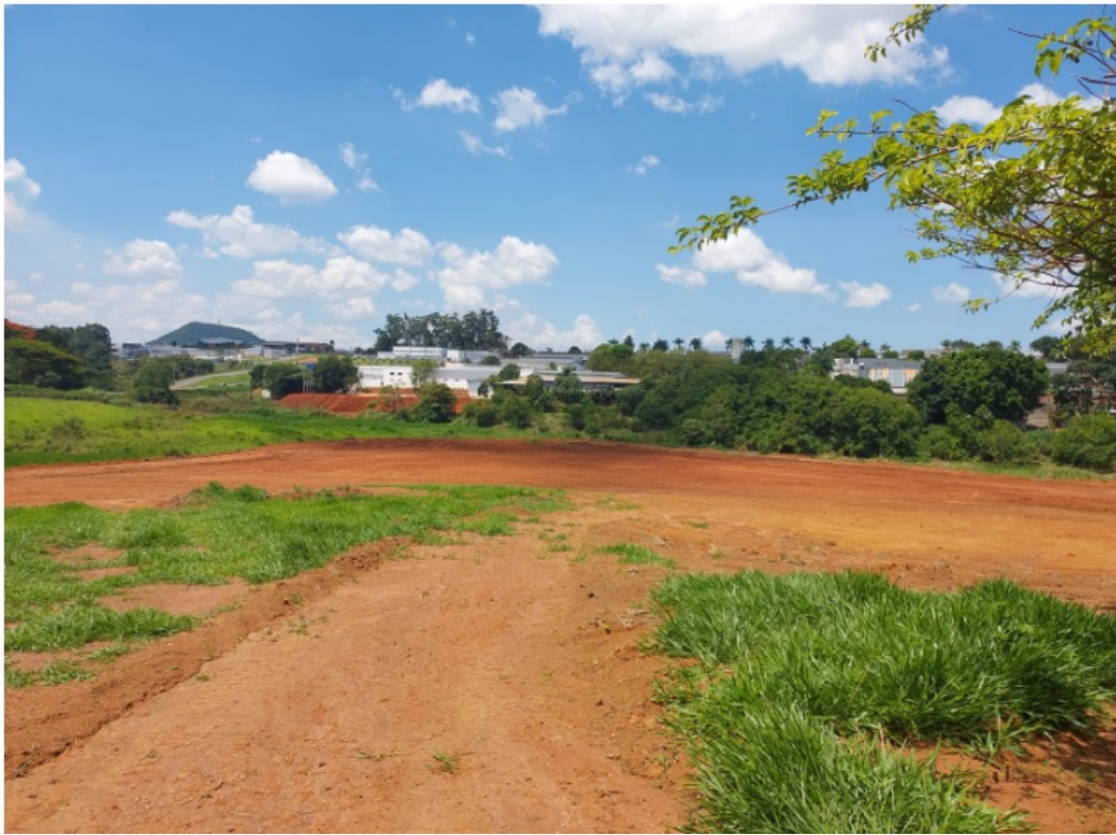
Foto 1. Área já em terraplanagem após o desvio do recurso hídrico.