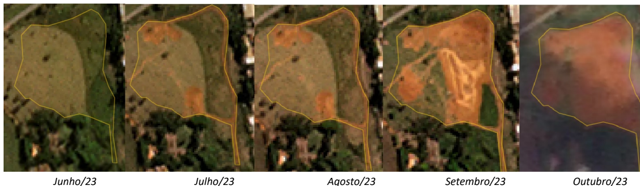
Figura 1. Imagens do local do empreendimento em série temporal de junho a outubro de 2023, demonstrando a alteração do solo iniciando a atividade de instalação do loteamento.

Em vistoria técnica foi constatado que o empreendimento já se encontra em fase de instalação com terraplanagem do local, desde, pelo menos, julho de 2023, como se pode constatar por imagens de satélite da plataforma da polícia federal "Brasil Mais", SCON Geospatial exibidas na figura 1: