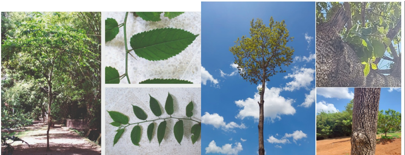
Foto 3. Comparativo entre a Maclura tinctoria (Taiuva ou Amoreira), à esquerda, e a árvore nº 32, à direita.

Desta maneira, devido às irregularidades encontradas e por não ser possível o prosseguimento da análise em razão da insuficiência técnica dos estudos apresentados sou pelo indeferimento do pleito.