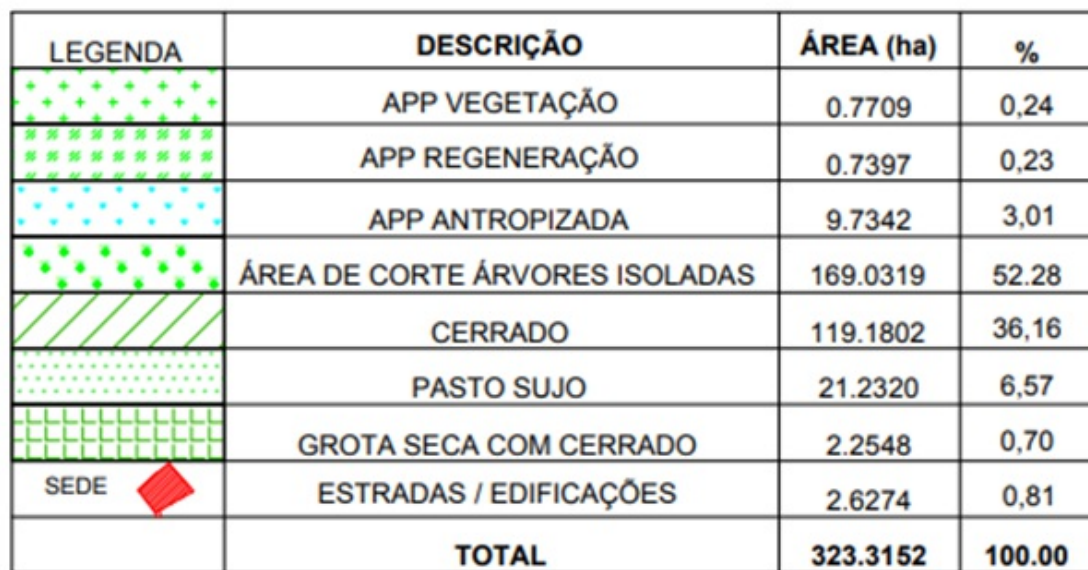
Figura 1: quadro de áreas da planta topográfica apresentada - Faz. Santa Maria de Baixo, lugar denominado São Pedro - Abaeté/MG

Após apresentação parcial dos documentos solicitados foi constatado que o CAR do imóvel não está em consonância com as informações trazidas pela planta topográfica da propriedade. Dessa forma, além de complementar a documentação solicitada o requerente deverá apresentar o CAR devidamente retificado, identificando as áreas de preservação permanente , área de reserva legal e áreas de uso antrópico .