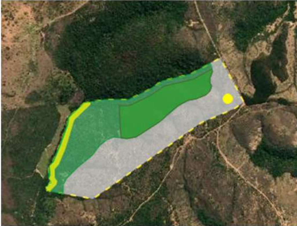
Foto 2 - Print da etapa GEO do CAR do imóvel - Faz. do Barreirinho / Cordisburgo-MG.

Foi requerido o corte ou aproveitamento de 15 (quinze) árvores isoladas nativas vivas em uma área de 1,00 ha na Faz. do Barreirinho, localizada no município de Cordisburgo-MG. De acordo com o documento n. 33359462 (planilha excel) são as seguintes espécies: sambaíba = 02; bate caixa = 01; capitão = 01; carne de vaca = 01; jacarandá do cerrado = 01; jatobá = 01; mamica de porca = 01; pau terra = 03; pimenta de macaco = 02; sucupira branca = 01 e tingui = 01.