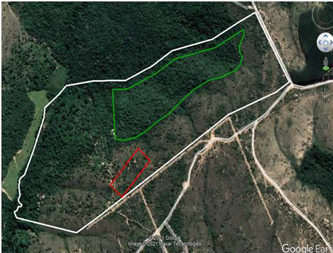
Foto 4 - Imagem Google earth (03/2019) com limites da propriedade (polígono branco), da área de Reserva Legal (polígono verde) e da área de intervenção requerida para corte de árvores (polígono vermelho) - Faz. do Barreirinho / Cordisburgo-MG.

Assim, percebe-se que o objetivo do requerente é a supressão de vegetação nativa para construção de galpão para a atividade de avicultura em sua propriedade, intervenção ambiental que não pode ser autorizada no âmbito de processo de corte de árvores isoladas nativas vivas.