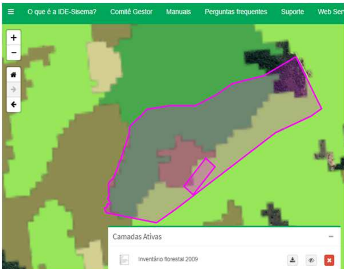
Foto 3 - imagem da Plataforma IDE-Sisema onde se verifica que a área requerida para intervenção (corte de árvores) é classificada predominantemente como fisionomia campestre (campo).