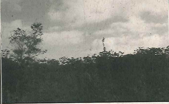
Foto – área de reserva legal