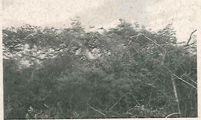
Área de reserva legal