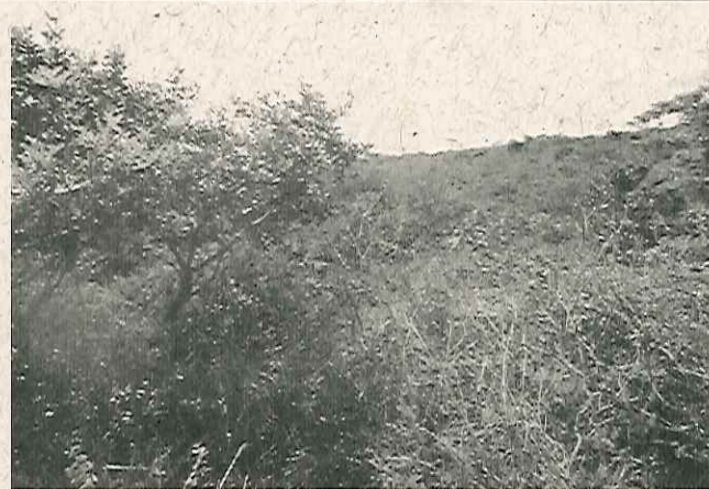
Área de reserva legal