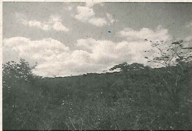
Foto – área de reserva legal