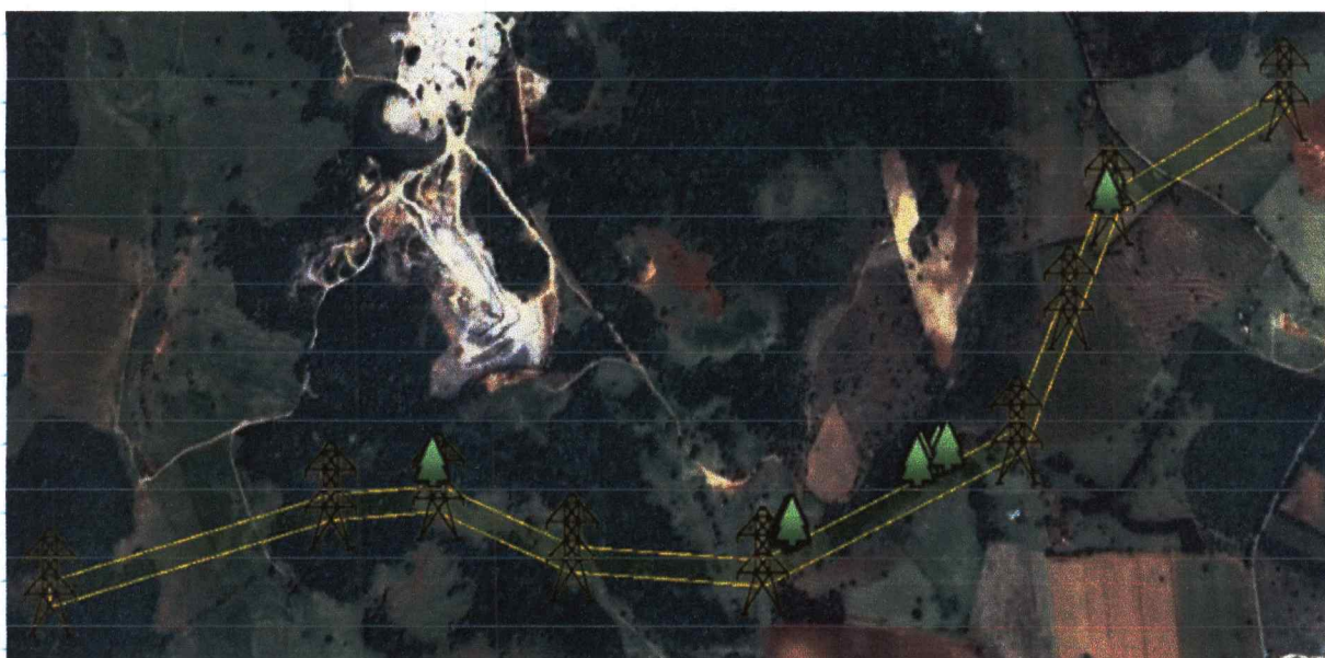
Tabela 1: Localização do desvio da Linha de Transmissão Pimenta-Barreiro 345 kV e sua respectiva área de servidão.