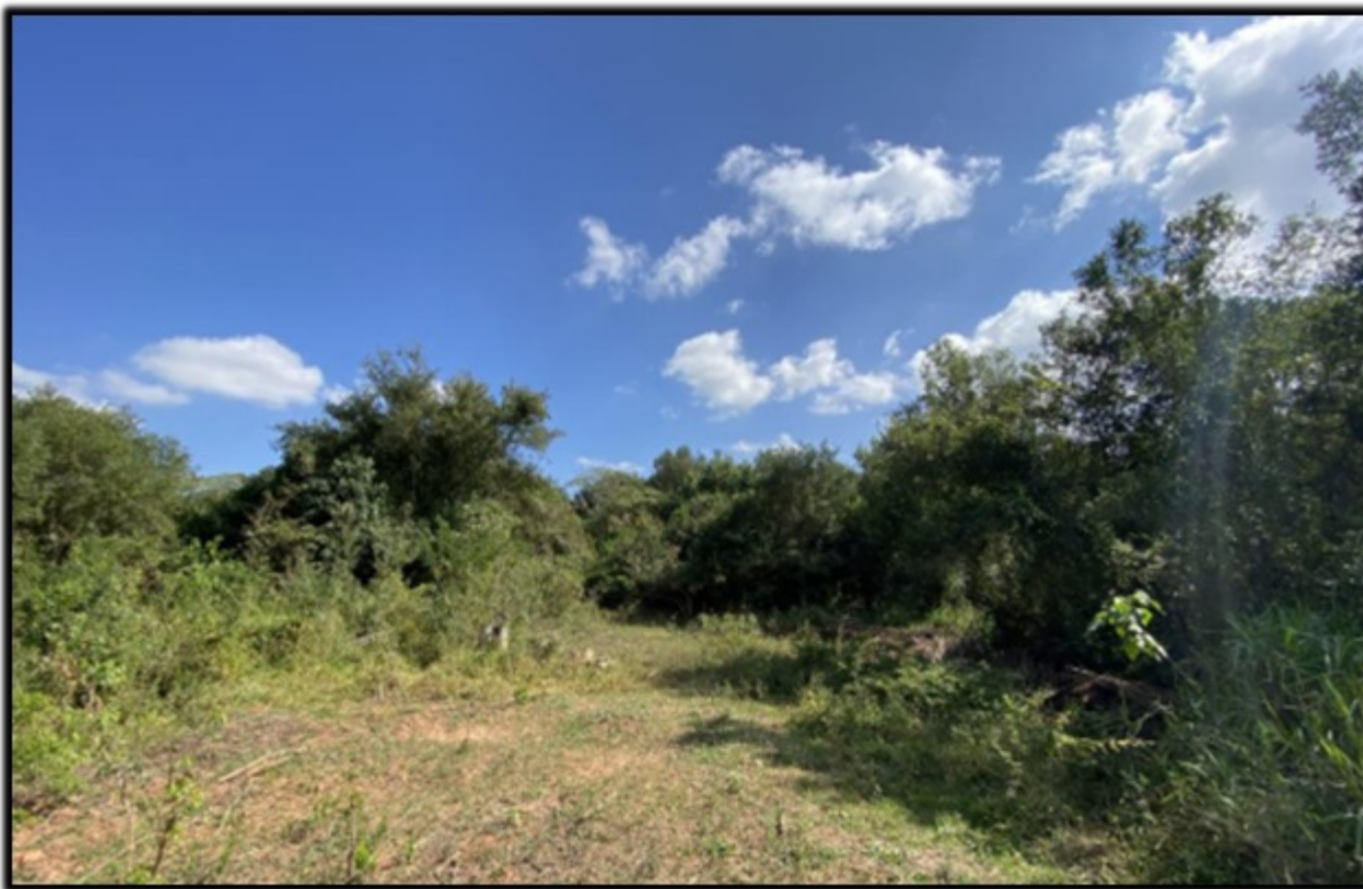
FIGURA 04: Área de preservação permanente do Rio das Antas na propriedade Sítio Recanto dos Lagos, bairro Guardinha, município de Monte Sião/MG.

A Área de Preservação Permanente, uma área de 1,5561 ha, presente na propriedade é recoberta por vegetação nativa, gramínea exótica (Braquiária) e árvores isoladas nativas, não está isolada por cerca de arame e não há vestígios de animais domésticos de médio e grande porte pastando no local.