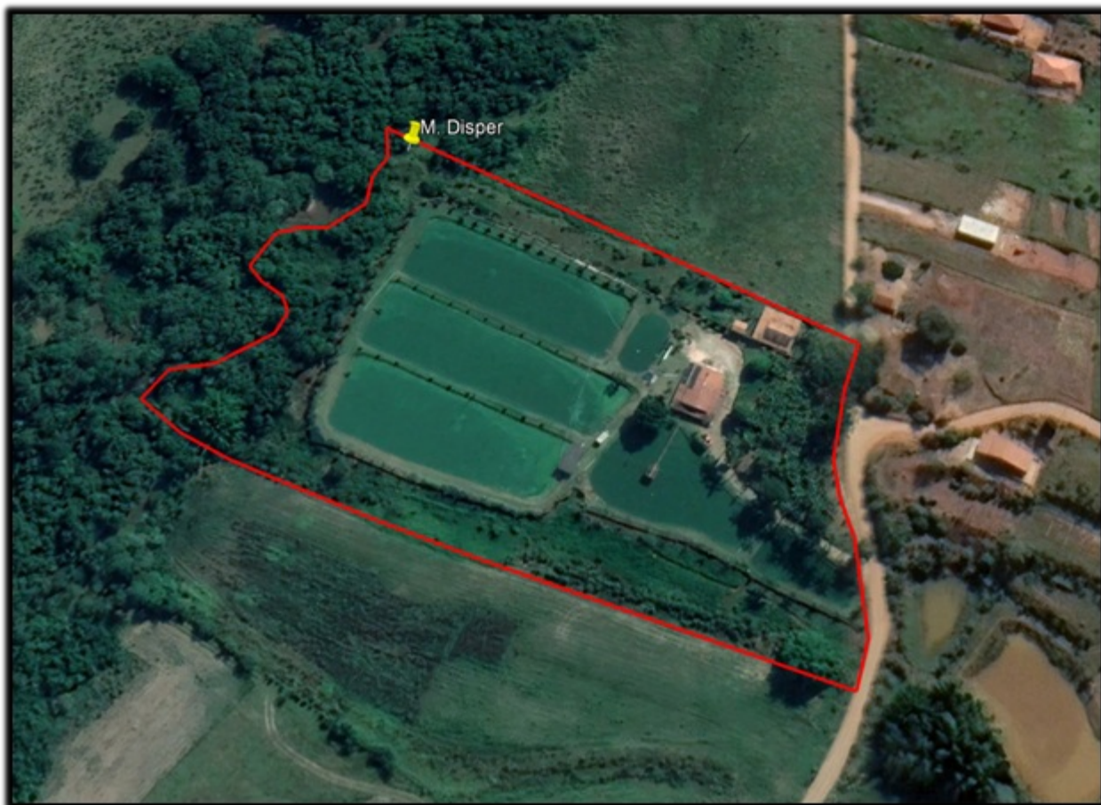
FIGURA 01: Panorâmica do empreendimento (extração areia) na propriedade Sítio Recanto dos Lagos, bairro Guardinha, município de Monte Sião/MG (Imagem Google Earth 2023).

Conforme definição do Mapa de Aplicação da Lei número 11.428/06, elaborado pelo IBGE e informações constantes no IDE SISEMA, a propriedade Sítio Recanto dos Lagos está localizado nos domínios do Bioma Mata Atlântica.