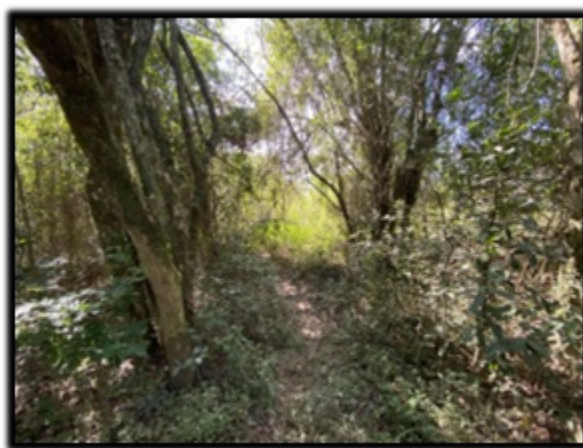
FIGURA 05 e 06: Área de preservação permanente onde passarão as tubulações de retirada e retorno no Rio das Antas na propriedade Sítio Recanto dos Lagos, bairro Guardinha, município de Monte Sião/MG.

Taxa de Expediente: DAE nº. 1401338911881 (R$813,07), pago em 20/06/2024