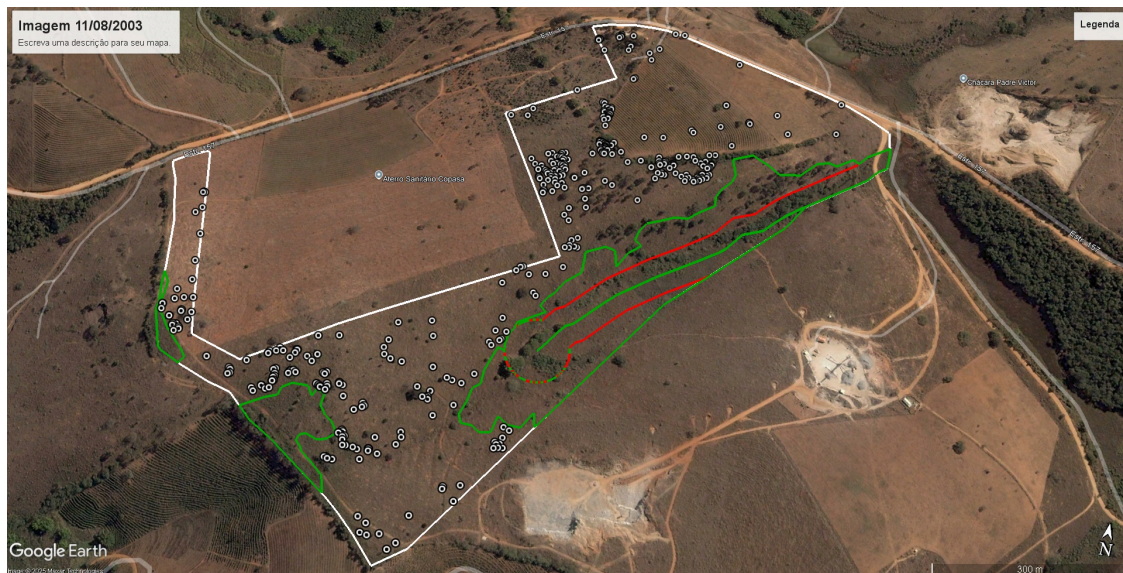
Imagem 01 - fonte: Google Earth

Conforme art. 24 da Resolução Conjunta SEMAD/IEF Nº 3.102, de 26 de outubro de 2021, realizada vistoria remota em 21/07/2025, através de utilização de imagens de satélite e outras geotecnologias disponíveis e foi assim constatado que não houve atividades antrópicas ilegais no período de 11/08/2003 e 20/03/2025 conforme imagens históricas do Google Earth nas referidas datas e constatado ainda através do Mapbiomas se tratar de área antropizada conforme figura abaixo.