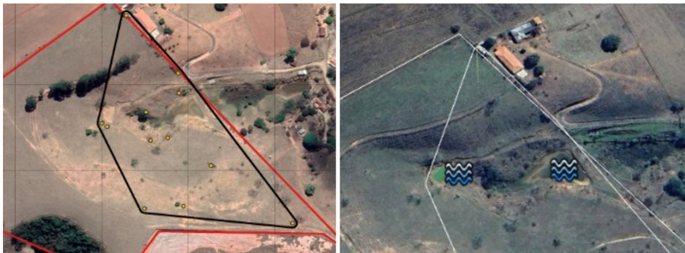
Figura 01: Localização das árvores requeridas/área de intervenção conforme croqui anexado.

Especificar: Conforme figuras 01 e 02 é visível pelas imagens presença de surgência de água no local, inclusive com existência de barramento consolidado. Na Figura 01 é possível verificar a poligonal de intervenção com localização das árvores requeridas e localização de barramento e curso d'água, sendo estas características sequer citadas no processo. Na Figura 02 verifica-se a indicação de curso d'água pela base de dados do módulo CAR 2.0, assim como CAR da propriedade com inconformidades de indicação de reserva e características do imóvel. Parte da área de intervenção encontra-se em APP e até em reserva indicada no CAR pelo próprio requerente. No processo não há qualquer menção ou caracterização dos fatos, mesmo que plotados no croqui anexado como imagem de fundo.