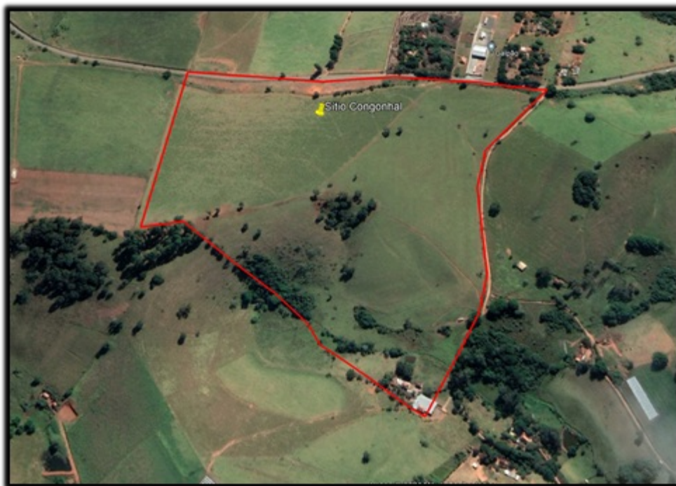
FIGURA 01: Imagem do imóvel (linha vermelha) Sítio Congonhal, Bairro Congonhal, município de Estiva/MG, (Google Earth 2023).

O objetivo deste parecer é analisar o requerimento para Intervenção Ambiental, com o corte e aproveitamento de vinte e cinco (25) árvores isoladas nativas vivas , em uma área de 2,00 ha , com a finalidade de criação de bovinos, no Sítio Congonhal, Bairro Congonhal, no município de Estiva/MG, em conformidade com os padrões técnicos e legais vigentes.