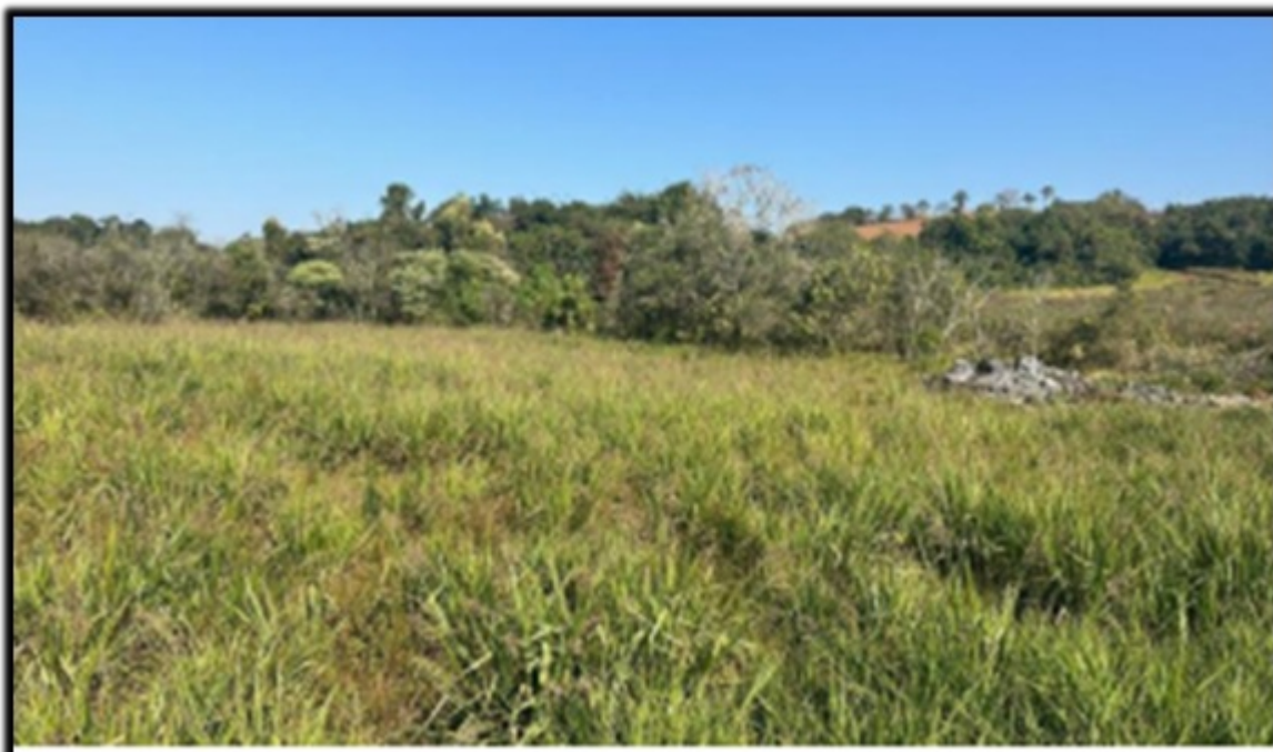
FIGURA 12: Local da área de compensação ambiental em APP, implantação do PRADA, no Sítio Pantaninho, bairro Cajuru, município de Pouso Alegre/MG.

Foi apresentado como medida compensatória, pela intervenção em APP sem supressão de cobertura vegetal nativa, a recomposição de uma área de 1,15 hectares ha, considerada área de preservação permanente, as margens do Ribeirão Pantaninho e área de preservação permanente de 2 (duas) nascentes através do plantio de 1.917 (mil novecentos e dezessete) mudas de espécies nativas da região, no espaçamento 3,0 x 3,0 m, coordenadas geográficas (UTM) 400.354 E / 7.533.295 S, 400.258 E / 7.533.849 S e 400.199 E / 7.533.072 S (Datum SIRGAS 2000, Fuso 23 K), descritas no Projeto Técnico de Reconstituição de Flora – PTRF de responsabilidade da Tecnóloga em Gestão Ambiental, Thais Aparecida Costa da Silva, CREA-MG nº. MG 239907/D, ART de Obra / Serviço nº. MG20243123097. O local está recoberto por gramínea exótica rasteira e não está isolado por cerca.