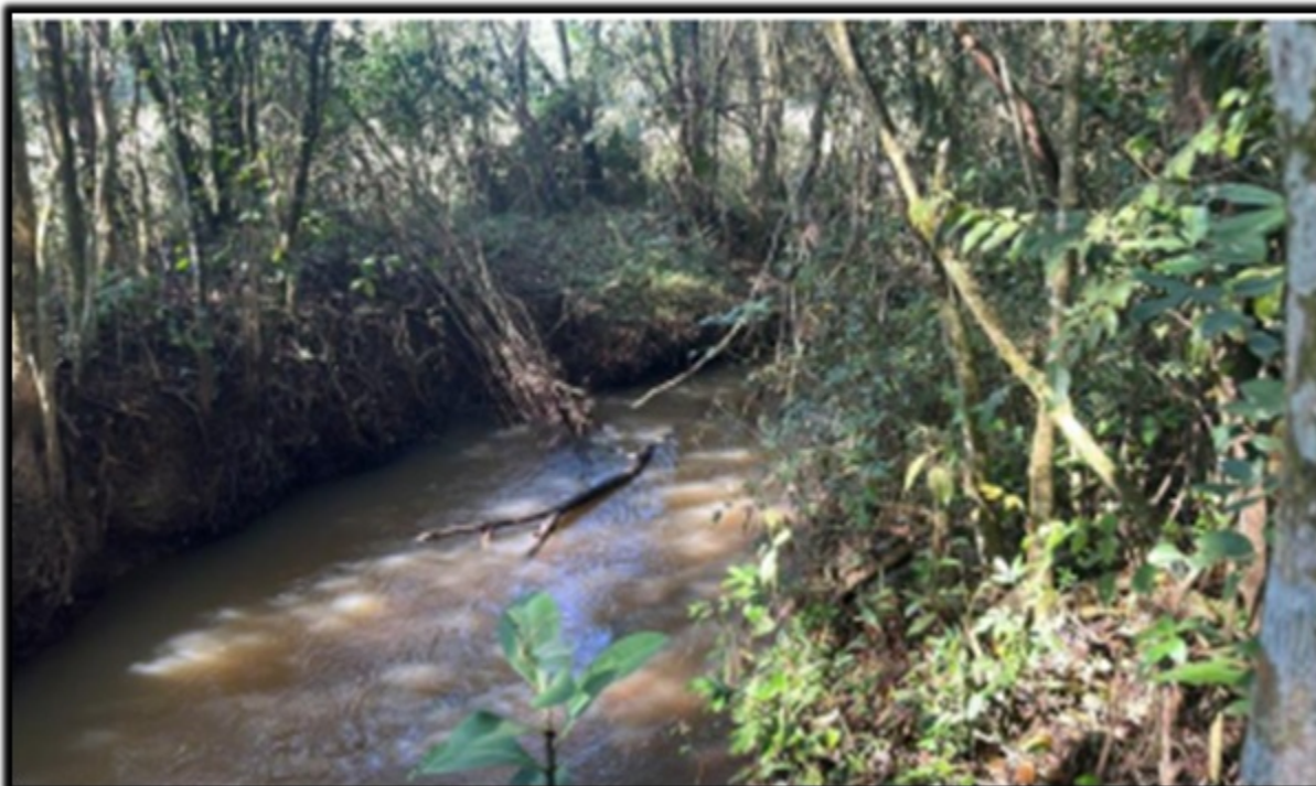
FIGURA 09: Imagem do Ribeirão Pantaninho, presente no Sítio Pantaninho, Bairro Cajuru, município de Pouso Alegre/MG