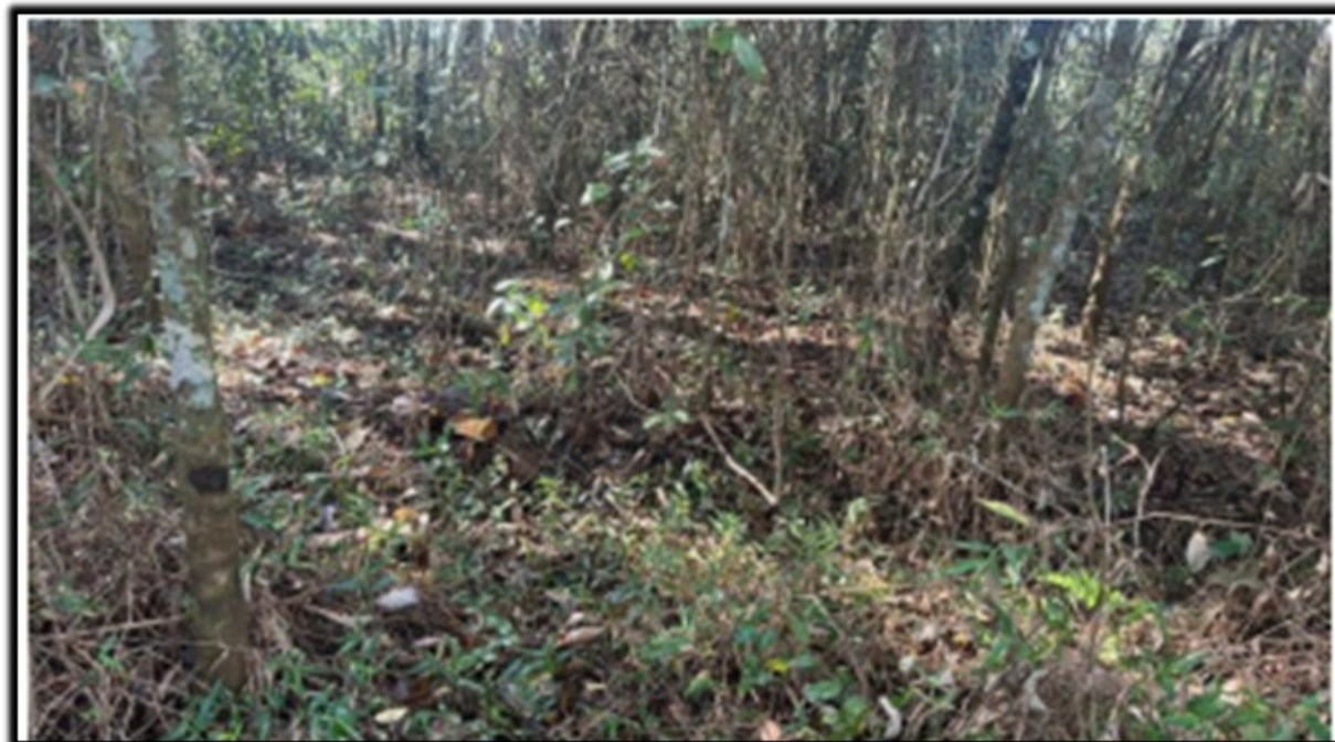
FIGURA 03: Local da intervenção ambiental, construção de rede de lançamento de efluentes tratados, no Sítio Pantaninho, Bairro Cajuru, município de Pouso Alegre/MG.

Foi constatado que não ocorrerá supressão de vegetação nativa de porte arbustivo ou arbóreo no local da intervenção.