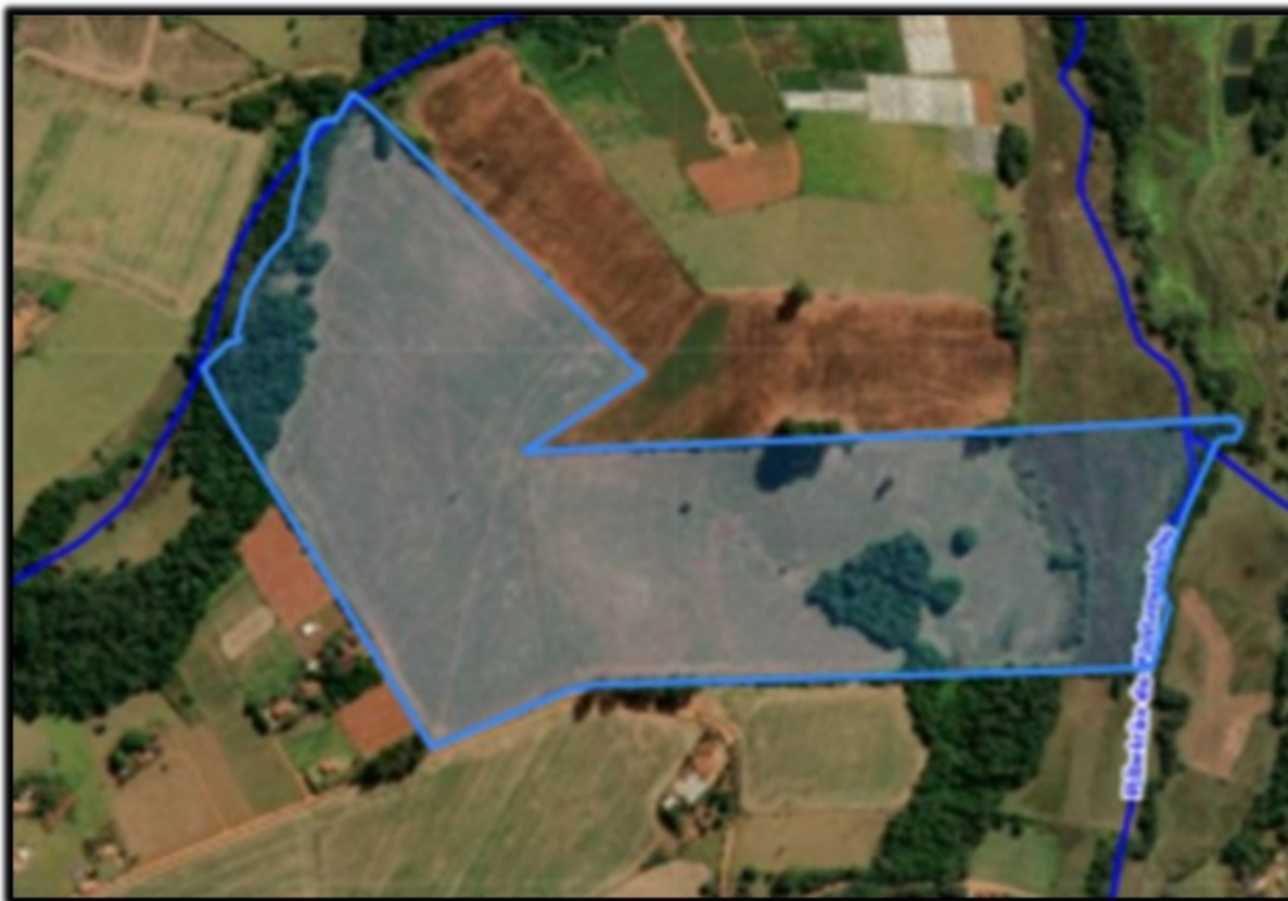
FIGURA 01: Imagem do imóvel Sítio Pantaninho (demarcação azul),

Conforme definição do Mapa de Aplicação da Lei número 11.428/06, elaborado pelo IBGE e informações constantes no IDE SISEMA, o Sítio Pantaninho está localizado nos domínios do Bioma Mata Atlântica.