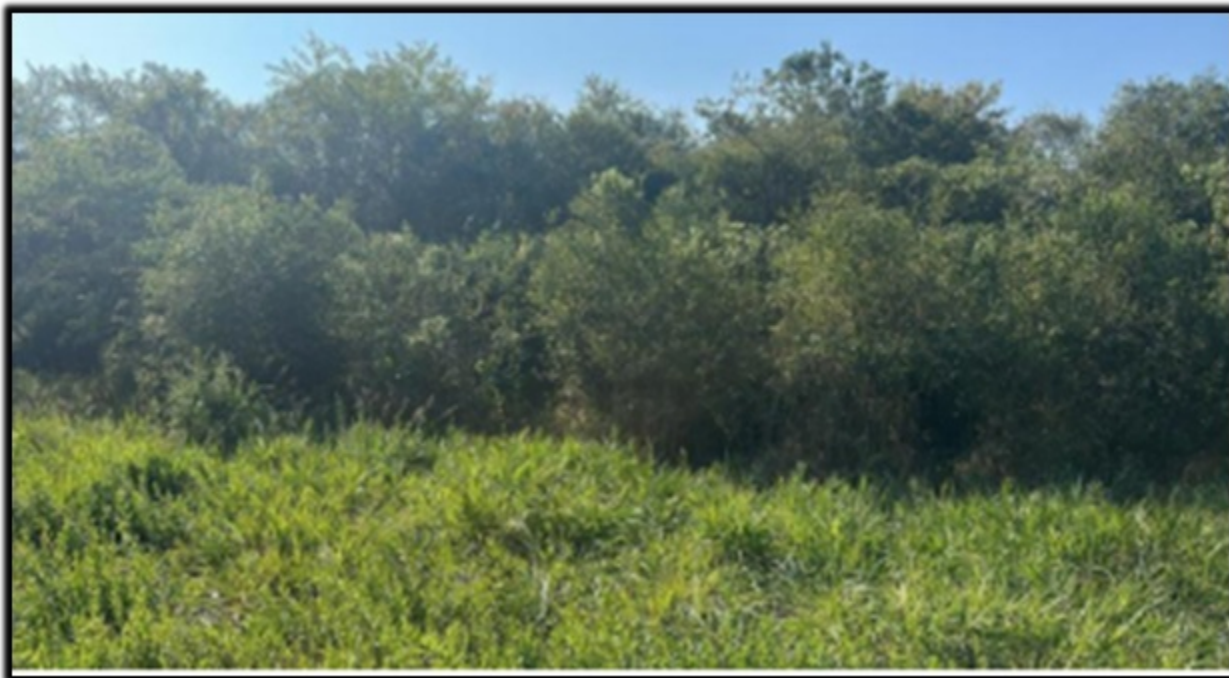
FIGURA 04: Imagem da área de preservação permanente – APP do Ribeirão Pantaninho, presente no Sítio Pantaninho, Bairro Cajuru, município de Pouso Alegre/MG, onde não ocorrerá intervenção ambiental.

vestígios de animais domésticos de médio e grande porte pastando no local.