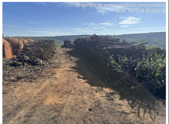
Imagem 1: Material gerado pela intervenção autorizada enleirado próximo aos fornos construídos.