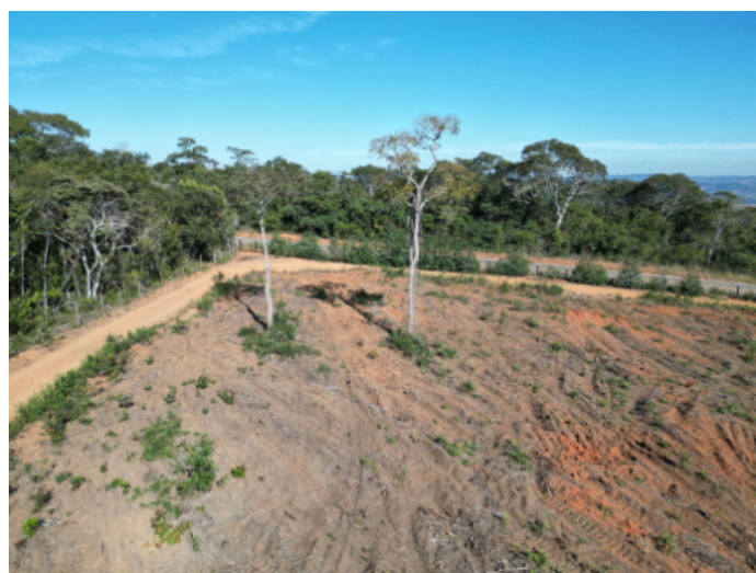
Imagem 7: Exemplares imunes de corte mantidos na área autorizada sem o devido raio de proteção.