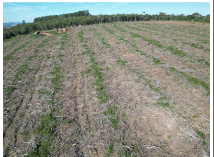
Imagem 3: Área suprimida com material gerado pela intervenção espalhados na área autorizada.