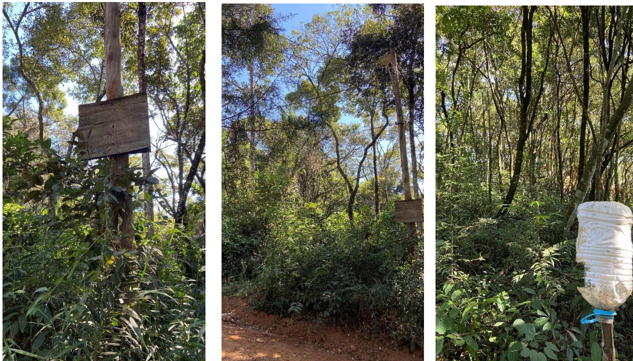
Imagem II - Imagem frontal do Lote do Florístico Testemunho.