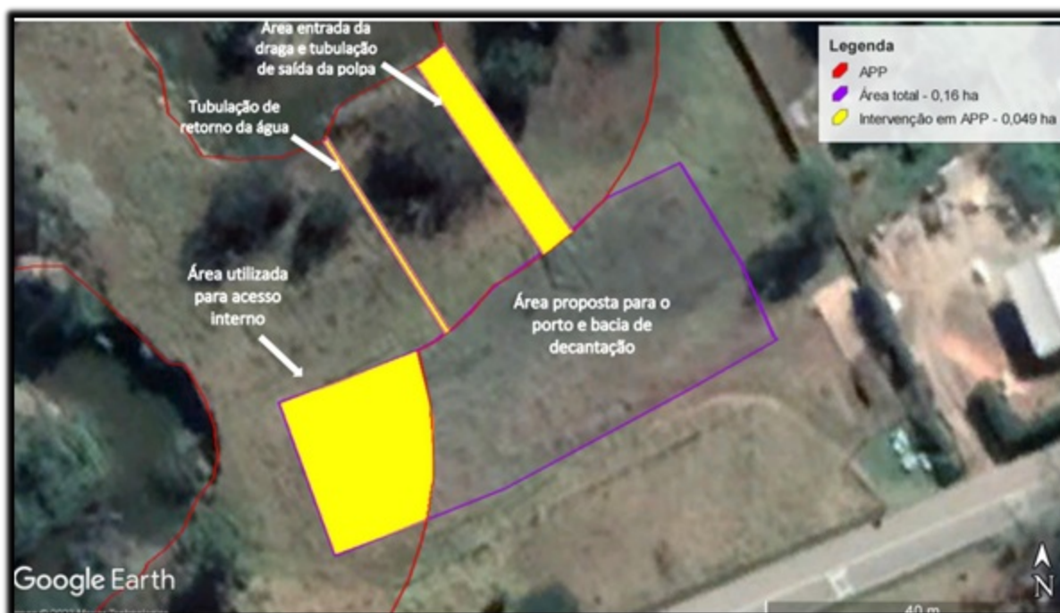
FIGURA 02: Imagem descrição do local das intervenções na propriedade Fazenda 2R, bairro Bicas de Baixo, município de Wenceslau Braz/MG

É requerida autorização para Intervenção Ambiental em APP sem supressão de vegetação nativa em área de 0,049 ha visando a implantação de estruturas para a extração mineral de areia e cascalho em leito do Rio Bicas, na propriedade Fazenda 2R, Bairro Bicas de Baixo, município de Wenceslau Braz/MG, coordenadas geográficas (UTM) N= 7.510.069 m e E = 460.412, (Datum: SIRGAS 2000/Fuso: 23 K), com a finalidade de utilização imediata na construção civil, conforme demarcação em planta topográfica.