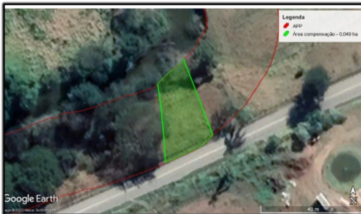
FIGURA 02: Imagem descrição do local da compensação na propriedade Fazenda 2R, bairro Bicas de Baixo, município de Wenceslau Braz/MG

Somos de parecer favorável à medida compensatória apresentada pela intervenção ambiental em APP, por esta estar em conformidade com a Legislação vigente e se encontrar dentro de área de preservação permanente e dentro da área de influência do empreendimento.