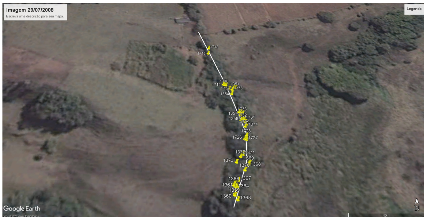
Imagem 01