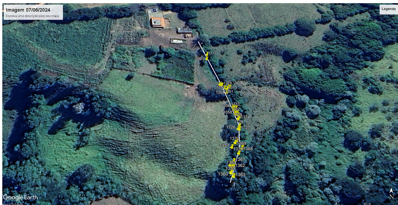
Imagem 02