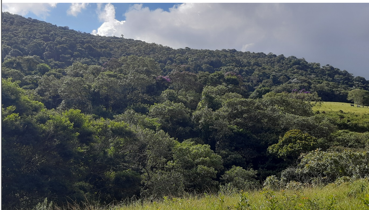
FIGURA 04: Imagem da área sob manejo sustentável no Sítio São Bernardo, Bairro São Bernardo, município de Natércia/MG.

O uso do solo da propriedade é composto por 00,26,11 ha de estradas, 00,42,87 ha de cascalheira, 06,07,11 ha de pastagem, 08,36,22 ha de vegetação nativa e 03,09,53 ha de candeia, conforme tabela de uso e ocupação do solo acostada ao processo. Possui no interior da propriedade áreas associadas a um curso d'água gerando uma APP total de 01,57,01 ha.