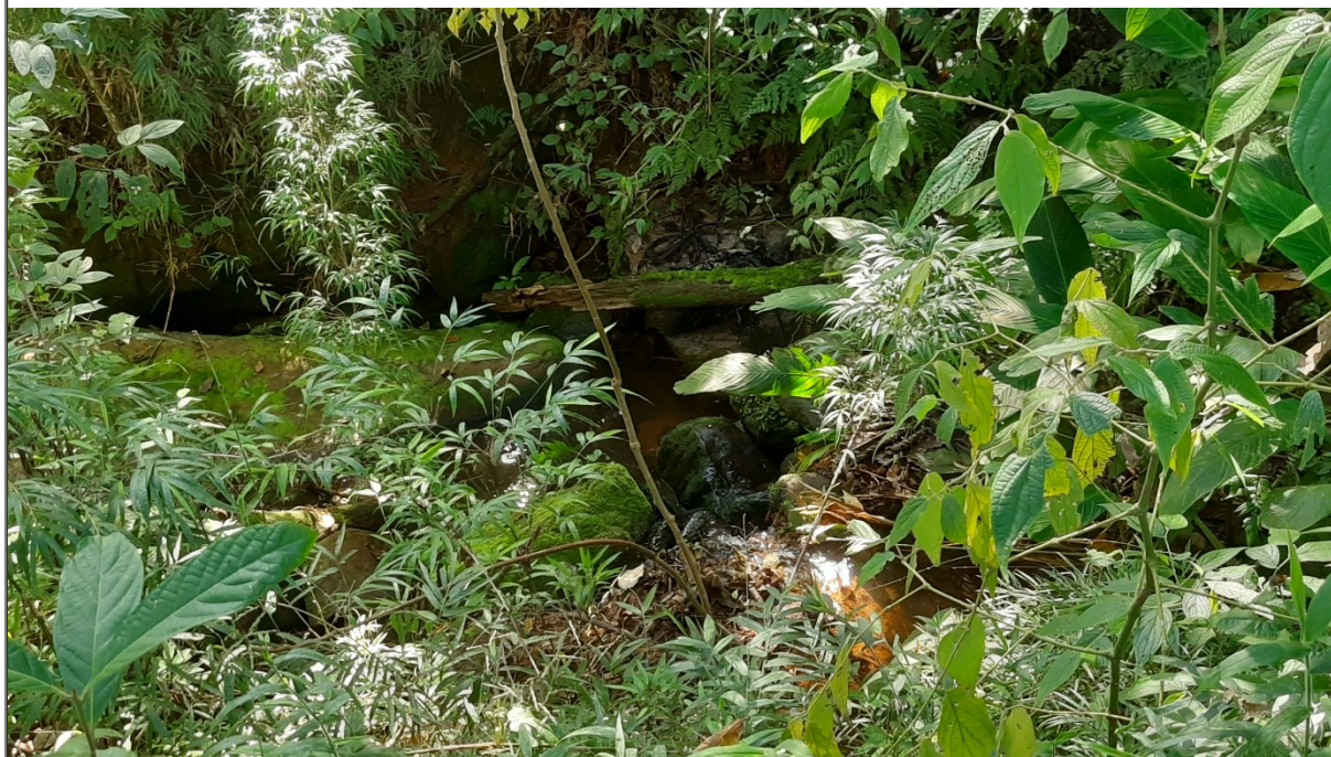
FIGURA 09: Imagem do curso d'água situado próximo à área de manejo sustentável da Candeia, na propriedade Sítio São Bernardo, município de Natércia/MG.