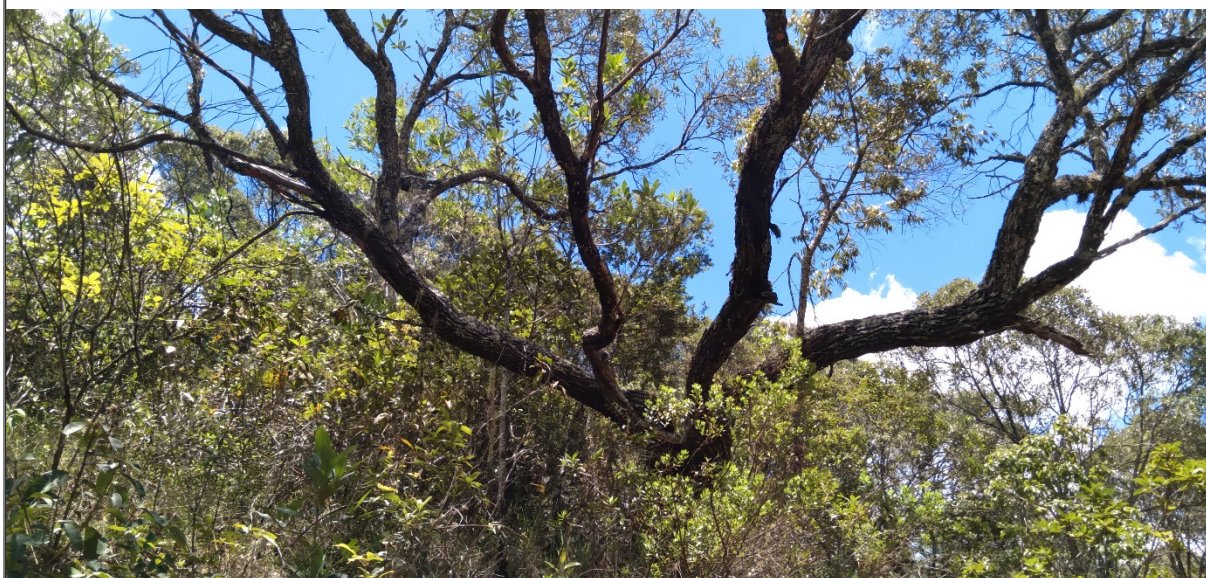
FIGURA 14: Indivíduo porta semente de Candeia ( Eremanthus erythropappus ) na propriedade Sítio São Bernardo, município de Natércia/MG, que não será cortado.

O Sistema de Exploração adotado é o Sistema de Porta – Sementes com Regeneração Natural, o qual manterá aproximadamente 250 indivíduos porta sementes por hectare, pois a cobertura vegetal do solo é restabelecida com rapidez, além de promover baixíssimo impacto ambiental. A derrubada da madeira será feita com motosserra através de corte em bisel a uma altura de 10 cm. Após o corte, o desgalhamento será feito com machado e foice e o desdobro com motosserra e/ou machado. A madeira será empilhada próximo ao local de abate e será embarcada no cargueiro instalado no lombo dos muare, que irão conduzir a lenha até um pátio de estocagem, sob coordenadas geográficas (UTM) 457.305 E / 7.558.511 S (Datum: SIRGAS 2000/Fuso: 23 K), localizado na mesma propriedade. O transporte do pátio de estocagem até a fonte consumidora será através de caminhões.