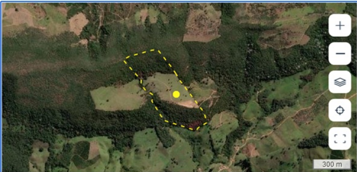
FIGURA 01: Imagem de satélite da Sítio São Bernardo, Bairro São Bernardo, município de Natércia/MG (Imagem Google Earth 2024), contemplado neste parecer.

O objetivo deste parecer é analisar o requerimento para Intervenção Ambiental, com supressão de vegetação nativa, em área total de 03,09,53 ha através da implantação de Plano de Manejo Sustentável da Vegetação Nativa, para a espécie florestal candeia – Eremanthus erythropappus , em dois fragmentos, na propriedade Sítio São Bernardo, Bairro São Bernardo, no município de Natércia/MG, em conformidade com os padrões técnicos e legais vigentes.