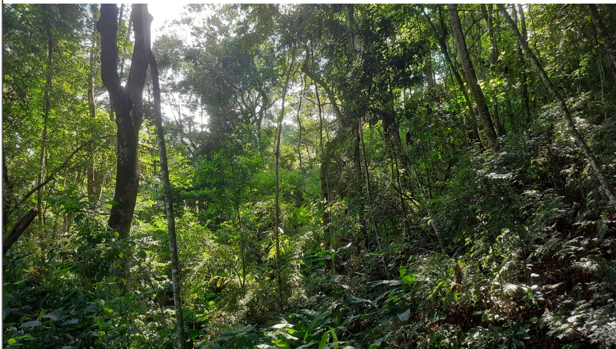
FIGURA 08: Imagem da área de preservação permanente presente na propriedade Sítio São Bernardo, município de Natércia/MG, que não sofrerá intervenção ambiental.

A Área de Preservação Permanente, presente na propriedade está recoberta por mata nativa classificada como Floresta Estacional Semidecidual Montana Secundária Média e gramínea exótica (Braquiária), não se encontra isolada por cerca de arame, em sua totalidade, e há vestígios de animais domésticos de médio e grande porte pastando no local.