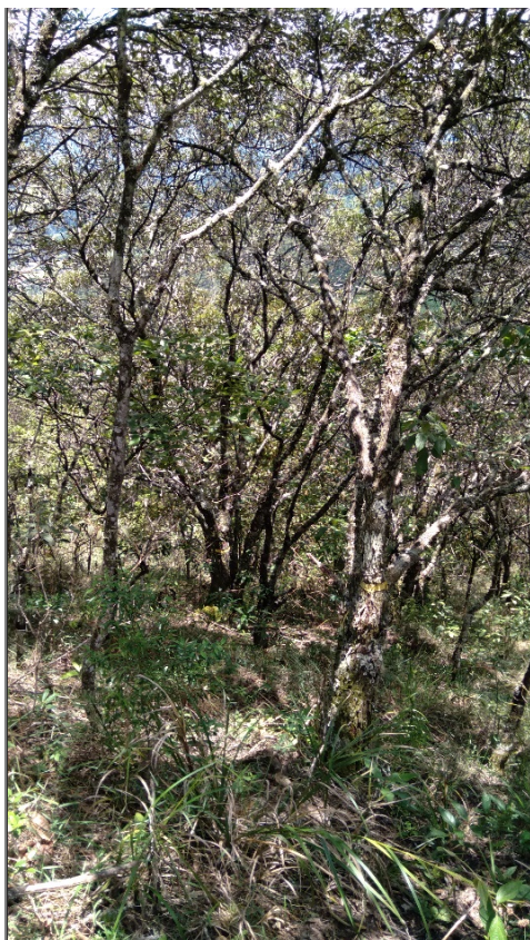
FIGURA 12: Indivíduos de Candeia ( Eremanthus erythropappus ) inventariados na propriedade Sítio São Bernardo, município de Natércia/MG.

Com os resultados obteve-se além do volume da madeira com casca, a estrutura da população florestal para os Fragmentos. A Frequência relativa , que é o resultado de indivíduos com ocorrência da espécie de candeia no fragmento, foi de 91,42% . A Dominância relativa , que é a área basal de todas as espécies de candeia nos fragmentos, foi de 87,10% . A Abundância relativa , que é o tamanho da população de candeia nos fragmentos, foi de 84,50% .