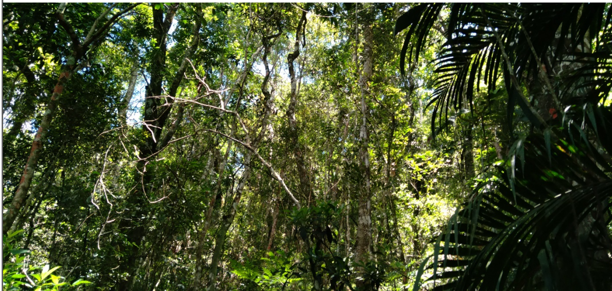
FIGURA 05: Área de Reserva Legal da Sítio São Bernardo, Bairro São Bernardo, município de Natércia/MG.

A Sítio São Bernardo possui CAR (Cadastro Ambiental Rural), número MG-3144409-52FF.7DE2.26D8.4310.906C.4893.4B26.1DD8, com uma área total considerada Reserva Legal de 3,88,16 ha, a qual é formada por dois fragmentos recoberto por vegetação nativa arbórea (Mata), classificada como Floresta Estacional Semidecidual Montana em estágio médio de regeneração natural. Os fragmentos não estão isolados, em sua totalidade, por cerca de arame e correspondem a 20,96% da área total do imóvel em questão.