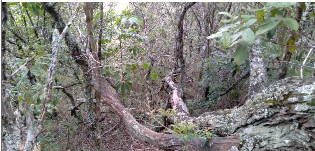
FIGURA 15: Fragmento com predominância da espécie Candeia e formação campestre, Sítio São Bernardo, município de Natércia/MG.

No que tange à vegetação da área requerida para manejo florestal, a mesma é composta por candeia em sua predominância, com formação campestre na cobertura do solo.