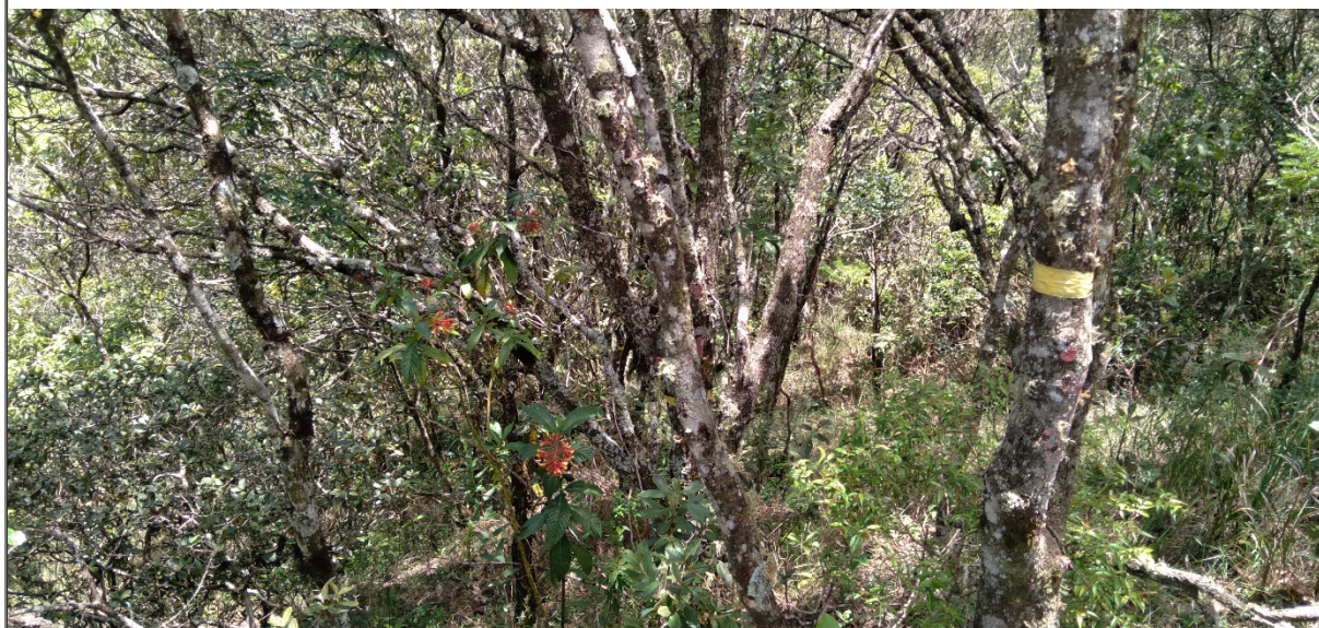
FIGURA 11: Parcela permanente na área requerida para manejo sustentável de candeia, na propriedade Sítio São Bernardo, município de Natércia/MG.

Na obtenção do volume de candeia do Fragmento requerido realizou-se inventário florestal através de Censo ou Inventário 100%, onde todas as espécies com DAP maior ou igual a 5 cm foram mensuradas. Os indivíduos foram identificados como “candeias” (vivas ou mortas) ou “não candeia”. Foi utilizado para a mensuração dos indivíduos fita métrica obtendo-se o CAP dos indivíduos e para a medição da altura fora utilizada vara telescópica graduada retrátil; posteriormente calculado o volume através de equação específica para candeia já que as demais espécies nativas não serão passíveis de exploração.