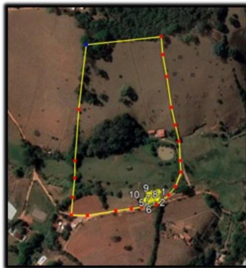
Figura 01: Localização das 11 árvores requeridas informadas na planta topográfica Figura 02: confirmação da localização das 11 árvores requeridas em imagem Google Earth