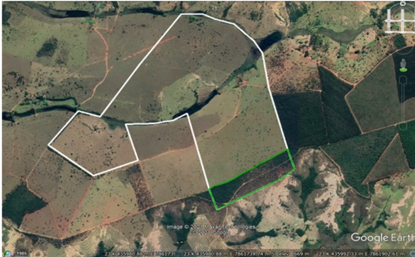
Imagem Google earth com polígono da propriedade (linha branca) e área de Reserva Legal (linha verde) - Faz. Japão / Quartel Geral-MG

[Neste item o gestor do processo poderá relacionar eventuais informações históricas, complementações, adequações documentais realizadas e outras questões pertinentes à análise processual. As informações complementares deverão ser solicitadas uma única vez, em um único documento. O ofício de informações complementares deverá reunir todas as informações necessárias para a finalização da análise do processo].