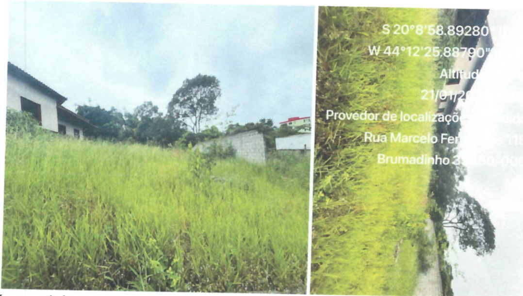
Imagens do interior do lote.