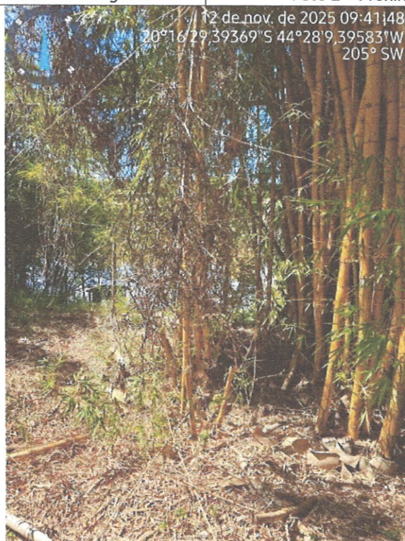
Figura 3 - Bambusa vulgaris .