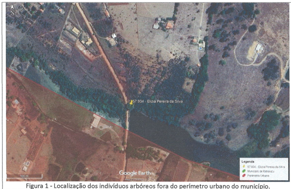
Figura 1 - Localização dos indivíduos arbóreos fora do perímetro urbano do município.

O local da intervenção situa-se na Zona Rural do Município de Itatiaiuçu, conforme mapa de zoneamento municipal, Lei Complementar nº 146/2020, na região denominada Medeiros, com área de topografia irregular e presença de vegetação típica de Floresta Estacional Semidecidual, pertencente ao Bioma Mata Atlântica.