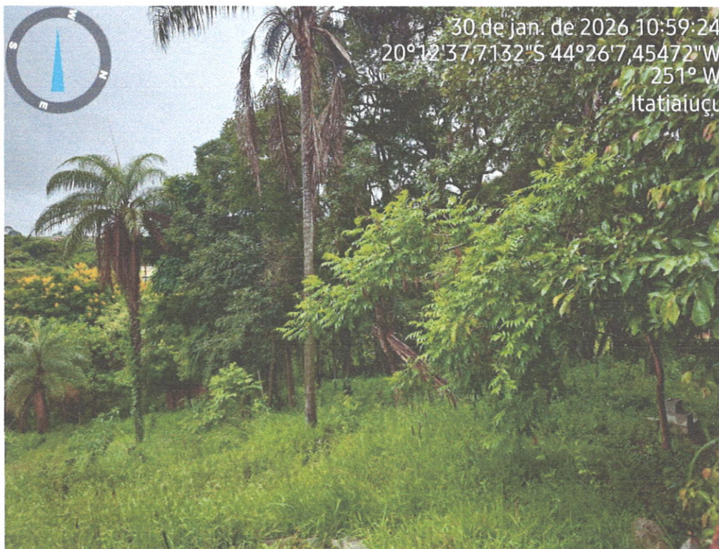
Foto 4 - Vistoria realizada no dia 30/01/2026.