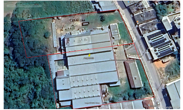
Fig. 3. Imagem de satélite ( Google Earth ) do ano de 2025, em que se constata ausência de indivíduos arbóreos anteriormente existentes.

Em resposta, foi enviada documentação para inclusão do processo de regularização do corte das árvores ao processo de licenciamento, que inclui: