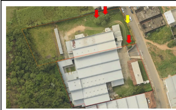
Fig. 2. Imagem aérea ortorretificada da Prefeitura Municipal de Ubá (2021), demonstrando presença das árvores isoladas (setas vermelhas) e fileira de árvores isoladas (setas amarelas) que foram posteriormente suprimidas.