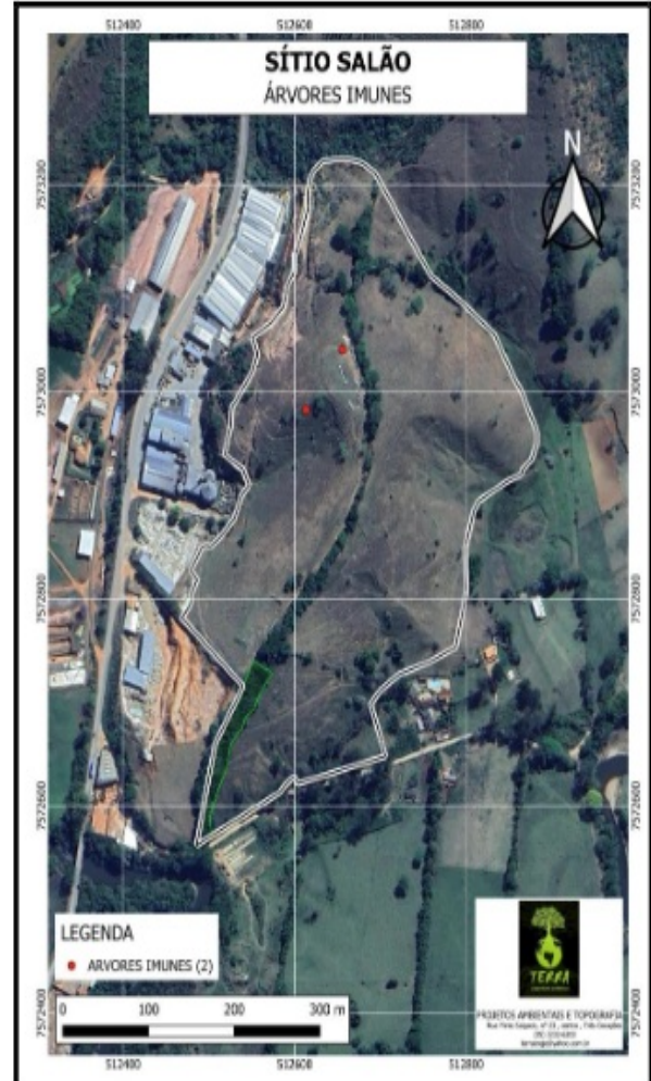
Identificação/Localização das árvores - Planilha de Campo