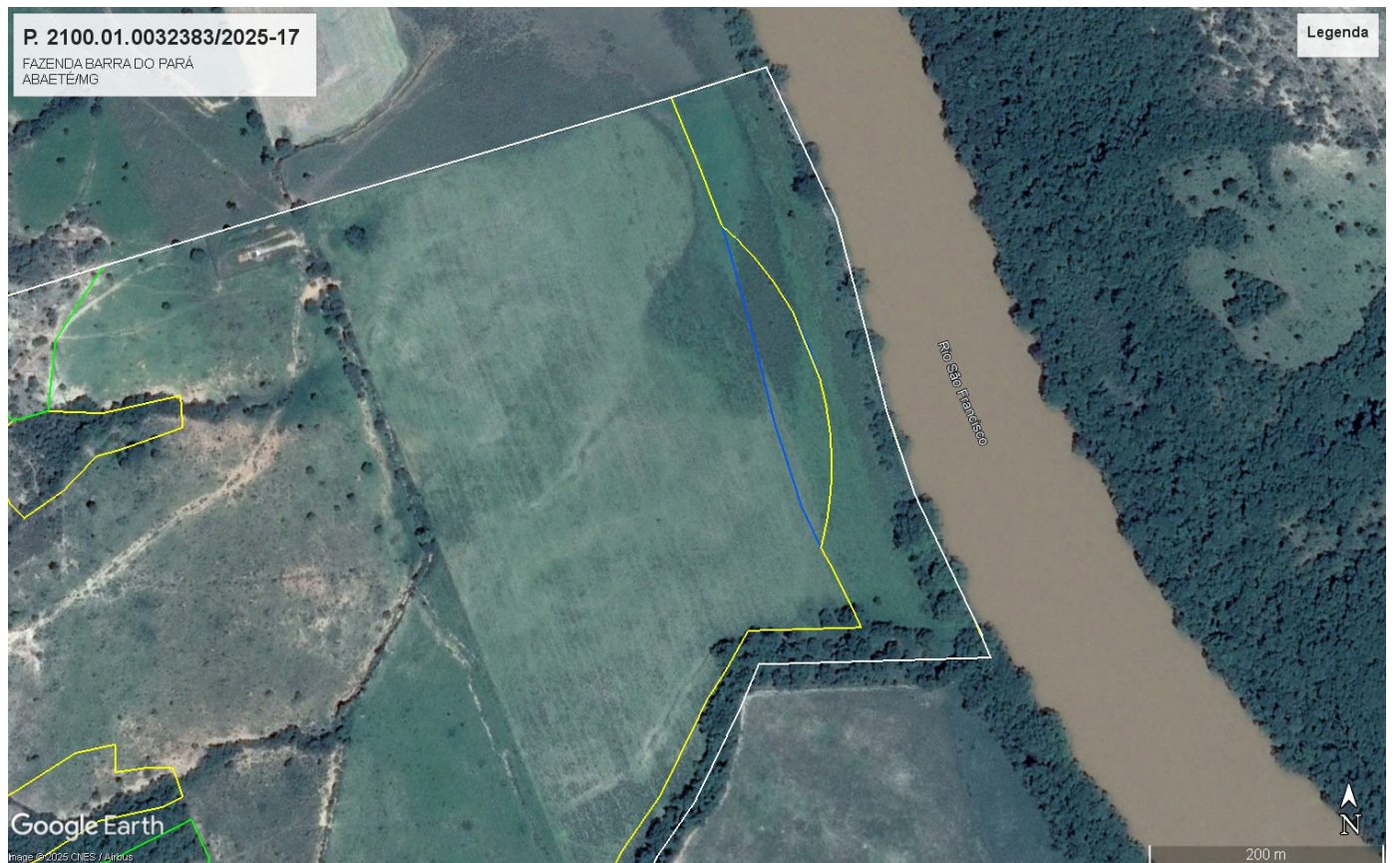
Figura 2: Desenvolvimento de culturas e áreas de uso antrópico consolidado em APP - Fazenda Barra do Pará (polígono branco) e área de reserva averbada (polígono verde) e áreas de APP (polígono amarelo) e área de utilização para culturas anuais em APP (polígono azul). - 2014