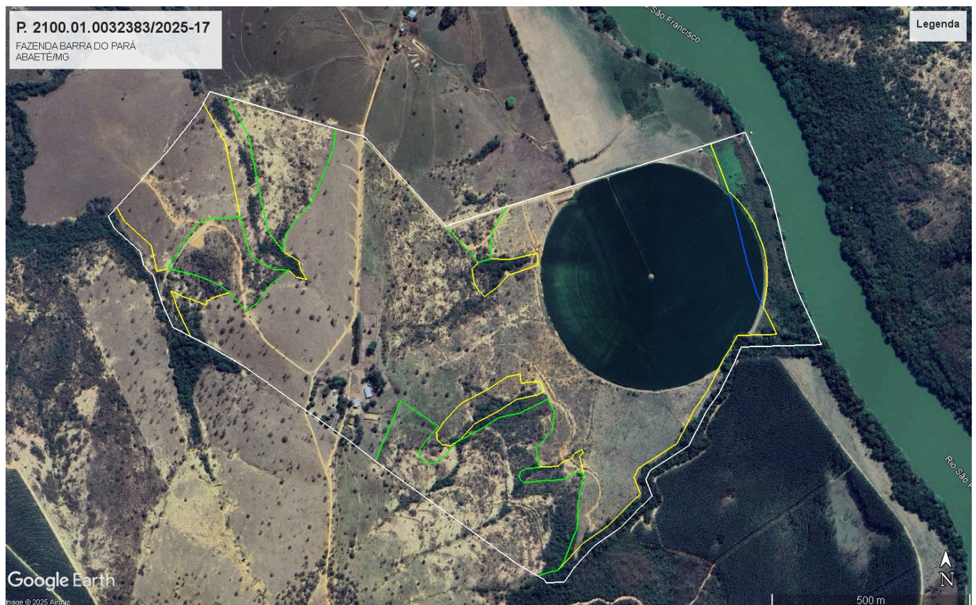
Figura 1: Fazenda Barra do Pará (polígono branco) e área de reserva averbada (polígono verde) e áreas de APP (polígono amarelo) e área de utilização para culturas anuais em APP (polígono azul).

Entretanto, o imóvel possui mesmo antes de 22 de julho de 2008, uso antrópico consolidado em APP com desenvolvimento de atividades agrícolas. Sendo que para esta atividade foi apontada uma área de utilização de 0,9825 ha.