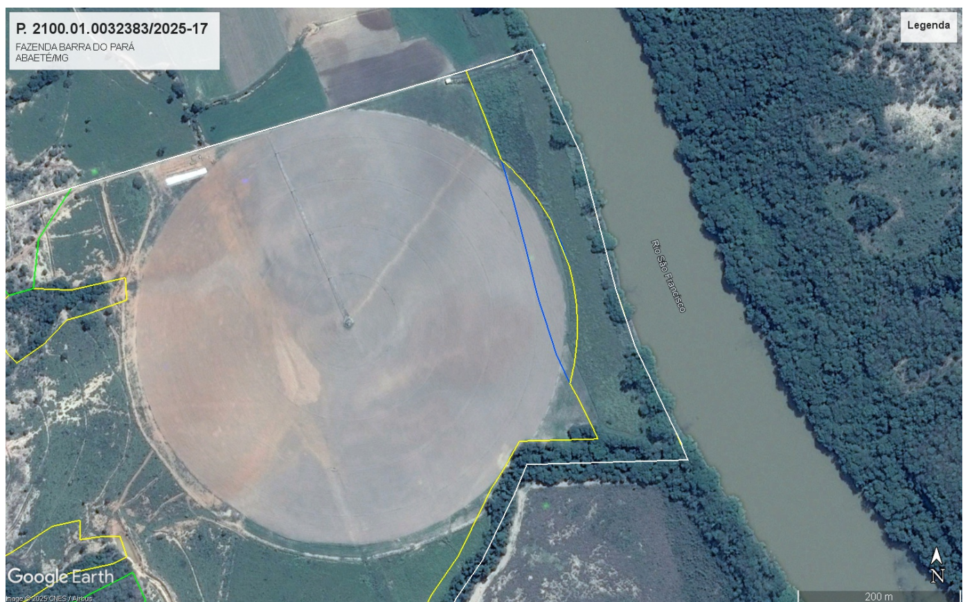
Figura 3: Após instalação do pivô - Fazenda Barra do Pará (polígono branco) e área de reserva averbada (polígono verde) e áreas de APP (polígono amarelo) e área de utilização para culturas anuais em APP (polígono azul). - 2017

Por se tratar de área com uso antrópico consolidado anterior a 2008, entende-se que deverá ocorrer a recuperação de uma faixa de 15 metros, podendo ser utilizada as demais áreas para continuidade do