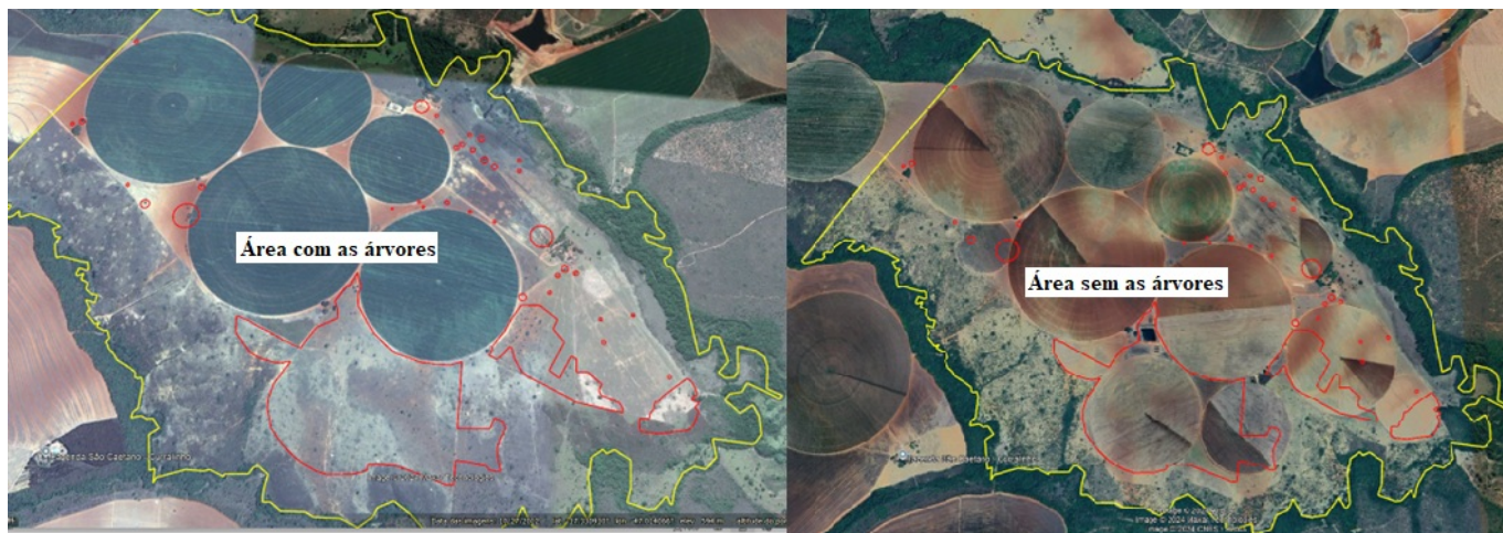
Imagem 01: Imagens de satélite de antes e depois do corte das árvores isoladas.

O corte de tais árvores foi alvo do auto de infração nº 376808/2024 e o autuado assinou termo de confissão e parcelamento de débito e já efetuou o pagamento da primeira parcela, tornando apto a regularização por meio da AIA corretiva.