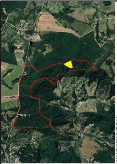
PLANTA DE LOCALIZAÇÃO (RELAZADA)