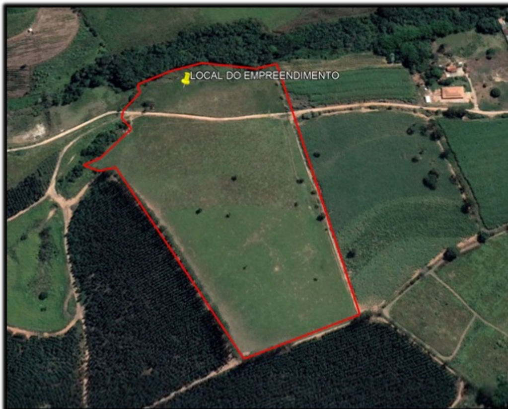
FIGURA 01: Imagem do imóvel (linha vermelha), Chácara São Pedro - Parcela 02, Bairro Floresta, município de Jacutinga/MG, (Google Earth 2023).

O objetivo deste parecer é analisar o requerimento para Intervenção Ambiental, com o corte e aproveitamento de sete (07) árvores isoladas nativas vivas, em uma área de 5,17 ha, a fim de implantação de infraestrutura de um sistema de geração de energia solar fotovoltaica com potência de até 2,5 MW, na propriedade rural Chácara São Pedro - Parcela 02, Bairro Floresta, município de Jacutinga/MG, em conformidade com os padrões técnicos e legais vigentes.