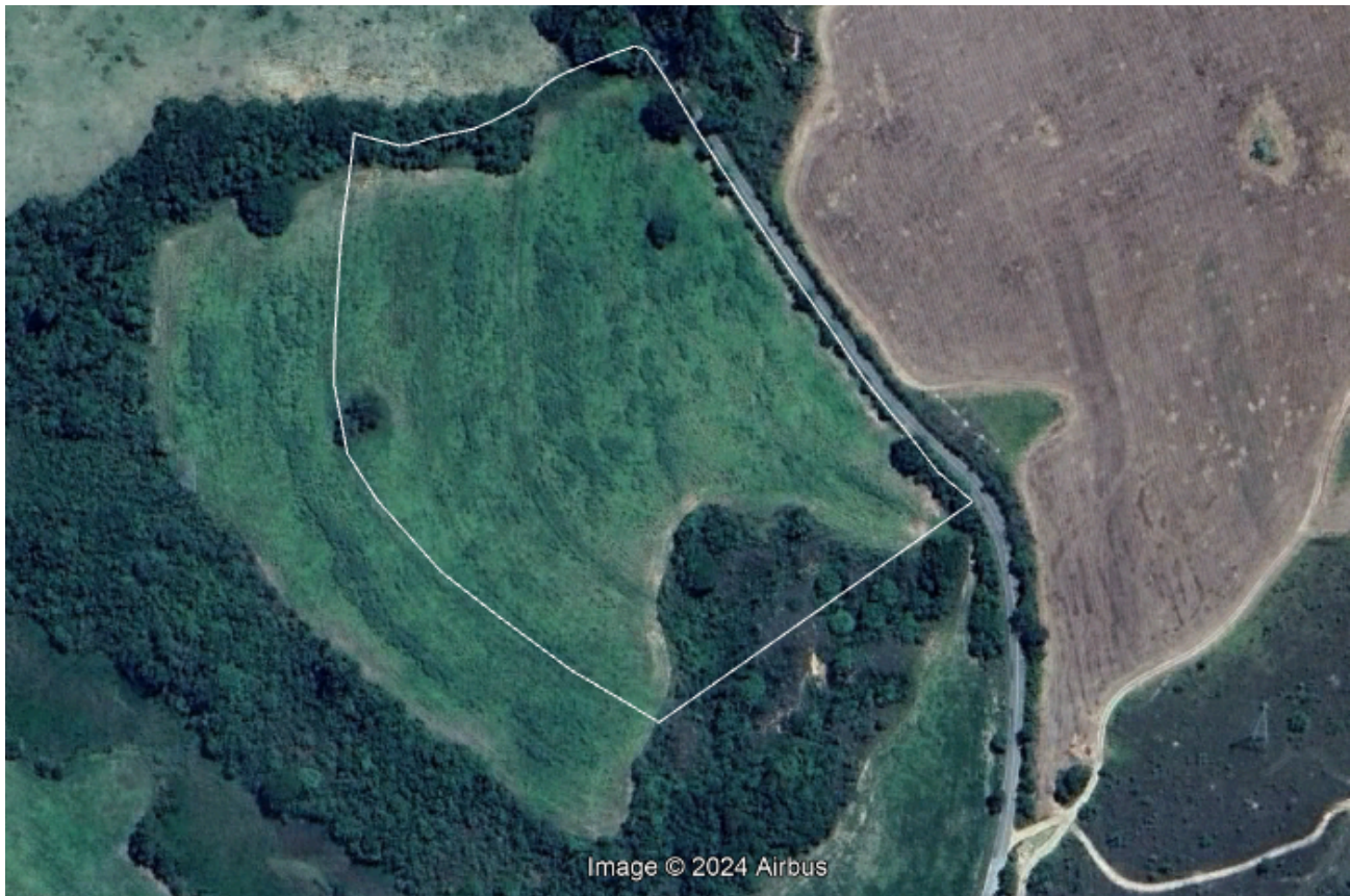
FIGURA 02: Imagem de satélite ano base 2023.