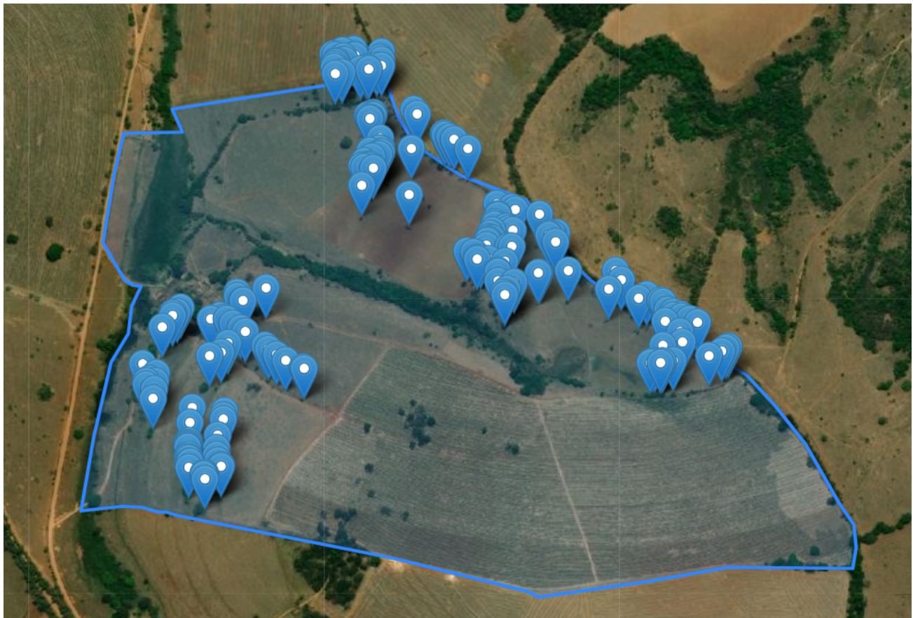
Figura 01: Localização das árvores requeridas para o corte.