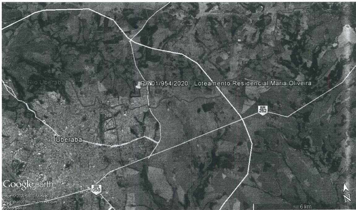
Figura 1 - Localização do empreendimento em Uberaba, marcador em amarelo. Em branco, limite do perímetro urbano. Em vermelho, limite da APA.