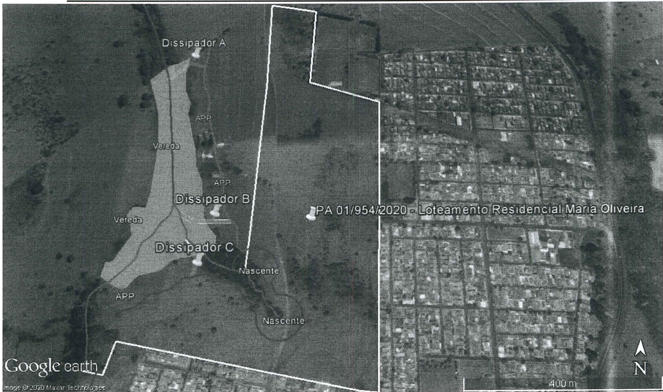
Figura 4 - Marcadores em amarelo, localização dos três dissipadores de energia. Limite em vermelho, APP e raio de 50 metros da faixa de proteção das nascentes. Perímetro em laranja, área de vereda. Limite em verde, APP e raio de 50 metros referentes à faixa de proteção da vereda. Perímetro em branco, área do loteamento Residencial Maria Oliveira. Limite em azul, curso d'água do Córrego Tira Papos.