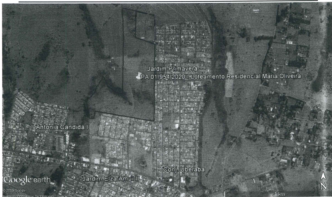
Figura 2 - Localização e perímetro do Residencial Maria Oliveira (marcador em amarelo e delimitação em azul) em Uberaba-MG.