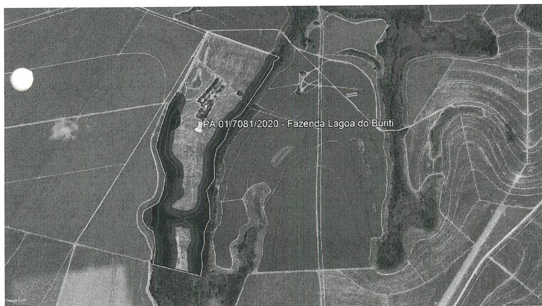
Figura 2 - Área da Fazenda Lagoa do Buriti (delimitação em amarelo), destacando-se as áreas de supressão (delimitação em verde), bem como as áreas de Preservação Permanente (delimitação em vermelho) – APPs e reserva legal (azul).