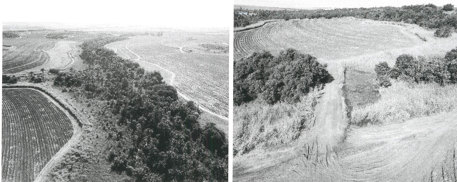
Figura 5 – Vista parcial da Fazenda Lagoa do Buriti.