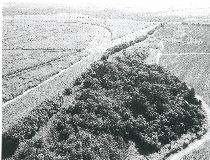
Figura 3 – Vista parcial da Fazenda Lagoa do Buriti.