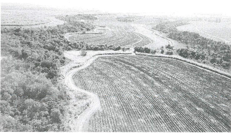
Figura 4 – Vista parcial da Fazenda Lagoa do Buriti.