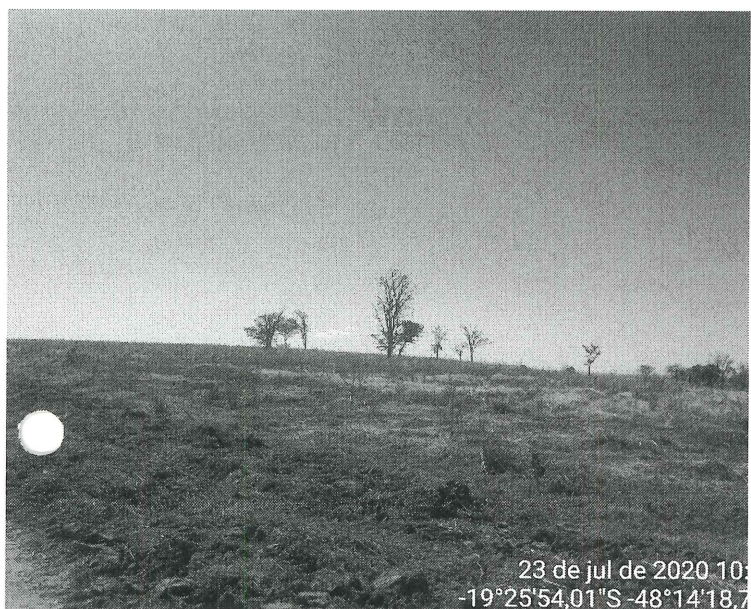
Figura 3 – Vista parcial da Fazenda Linda Flora.

23 de jul de 2020 10:00 -19°25'54,01"S -48°14'18,7"E