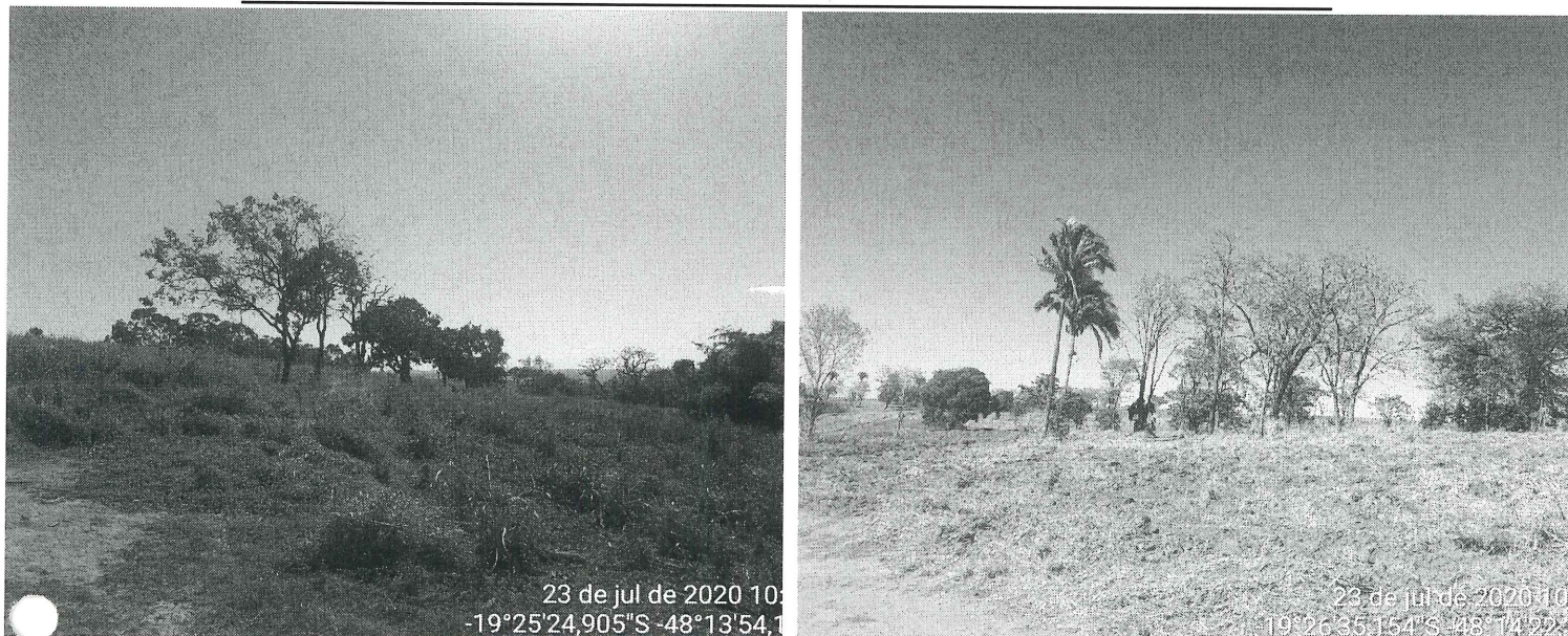
Figura 5 – Vista parcial da Fazenda Linda Flora.