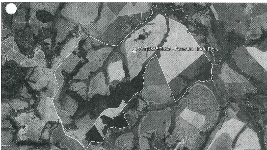
Figura 2 - Área de Fazenda Linda Flora (delimitação em amarelo), destacando-se as áreas de supressão (delimitação em verde), bem como as áreas de Preservação Permanente (delimitação em vermelho) – APPs e reserva legal (azul).