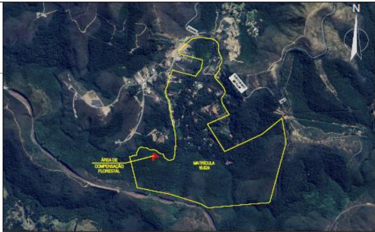
PLANTA DE LOCALIZAÇÃO ESCALA: 1/20.000