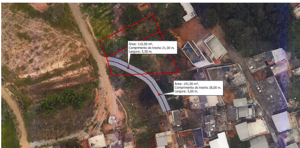
imagem 2: croqui demonstrativo das obras de ampliação da rua no local.

Durante a análise dos documentos apresentados e da vistoria realizada, verificamos se tratar de um pedido de supressão de (01) indivíduo arbóreo conhecido popularmente como Angico - Anadenanthera spp , localizado em área pública, na área de projeção das obras de ampliação de uma rua já existente ( imagem 2 ).