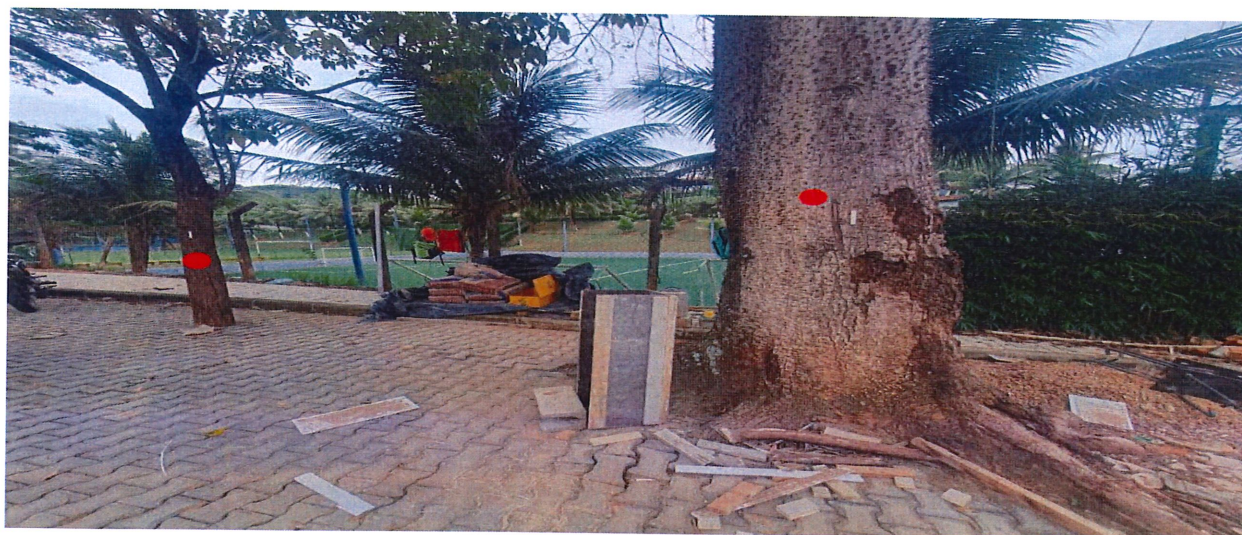
Relatório fotográfico: Em destaque (vermelho) as árvores objeto da supressão.