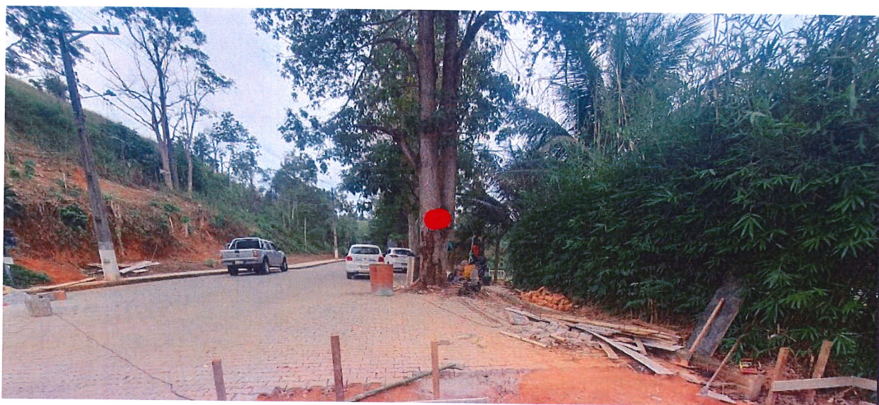
Relatório fotográfico: Obras de ampliação da via interna do imóvel.