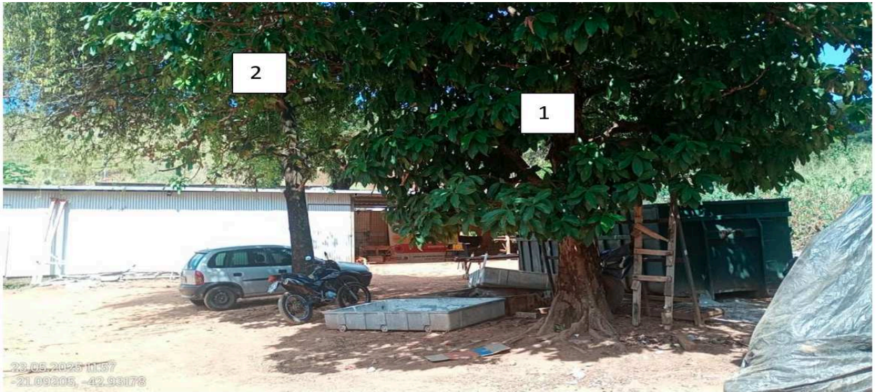
Imagem 5: 1 – Jambo ( Syzygium gaertneri ) e 2 – Amendoeira-da-praia ( Terminalia catappa ), ambas incluídas na solicitação de corte.