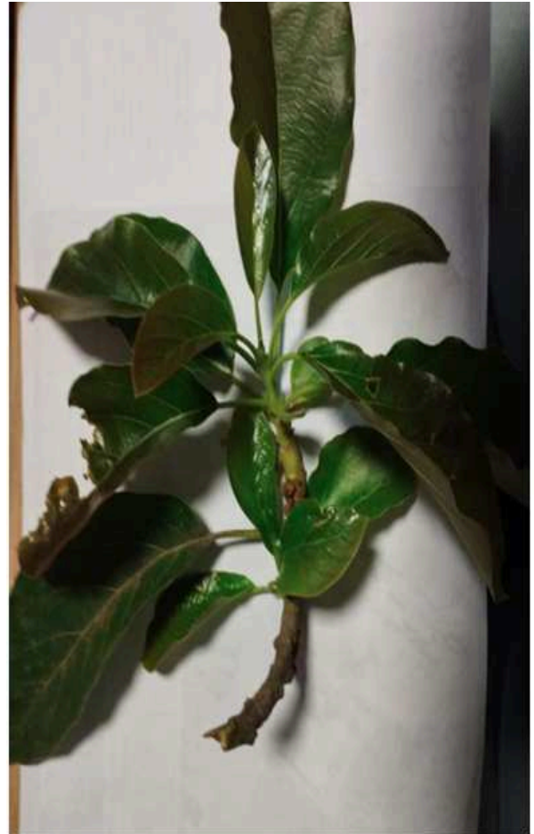
Imagem 9: Foto da folha de Abacateiro ( Persea americana Mill), usada para identificação.