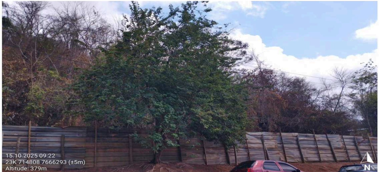
Imagem 1: Foto da árvore Sansão do Campo ( Mimosa caesalpinifolia ) objeto da solicitação de corte.