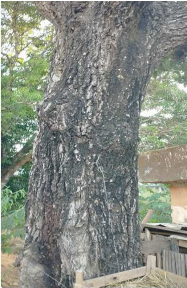
Imagem 7: Foto do Abacateiro ( Persea americana Mill), objeto da solicitação de corte.