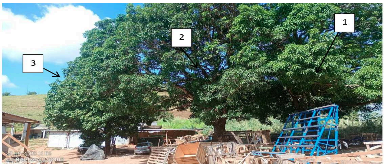
Imagem 2: Foto das árvores objeto da solicitação de corte. 1 e 2 – Mangueira ( Mangifera indica ) e 3 – Jambo ( Syzygium gaertn ).