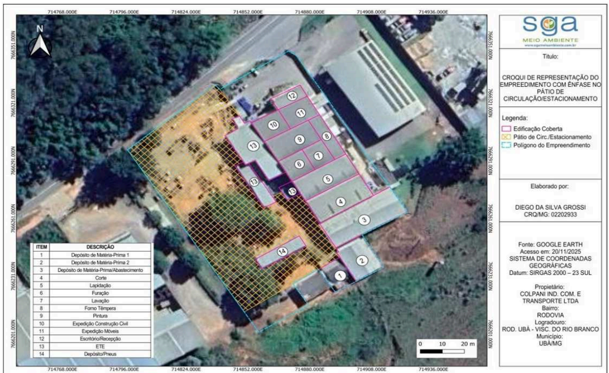
imagem 2: Recorte da imagem do empreendimento ilustrando o pátio de circulação e estacionamento.

(...) A finalidade do corte das árvores está diretamente vinculada ao aprimoramento da área destinada ao uso já consolidado pelo empreendimento ao espaço, notadamente circulação interna, estacionamento, descarga de matéria-prima e carregamento do produto final (expedição). A conformação atual do espaço tem gerado transtornos significativos e limitações operacionais, sobretudo pela necessidade de compatibilizar, em um mesmo ambiente, o fluxo de caminhões utilizados para carga e descarga e o estacionamento dos veículos de colaboradores e visitantes. O croqui abaixo (imagem 2), demonstra a disposição dos setores produtivos e logísticos do empreendimento, evidenciando que os depósitos de matéria-prima se localizam na parte posterior do galpão. Essa configuração exige área adequada para manobras dos veículos de grande porte, condição indispensável para aperfeiçoar o fluxo interno e garantir maior eficiência ao processo industrial. Além disso, é possível observar a área total do pátio de circulação pretendido, que o novo espaço atenderá perfeitamente a demanda de circulação e estacionamento projetada. Nesse contexto, o corte das árvores tem como objetivo exclusivo ampliar a área já utilizada, sem previsão de construção de edificações, execução de obras ou movimentação de solo.