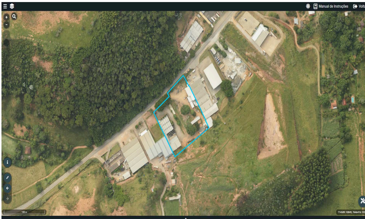
imagem 1: recorte da imagem do sistema Geo-Dados - 2021, demonstrando o imóvel da intervenção.

Verificamos a formalização no sistema eletrônico de processos administrativos do município de Ubá, o processo simplificado de corte de árvores isoladas vivas em nome de Distribuidora de Vidros Ubá Ltda, pessoa jurídica de direito privado, sociedade limitada, inscrita no CNPJ nº 02.497.408/0001-46, sediada na Rodovia Ubá/Visconde do Rio Branco, km 4, nº 3140, Eixo Rodoviário, perímetro urbano do Município de Ubá - Minas Gerais ( imagem 1 ).