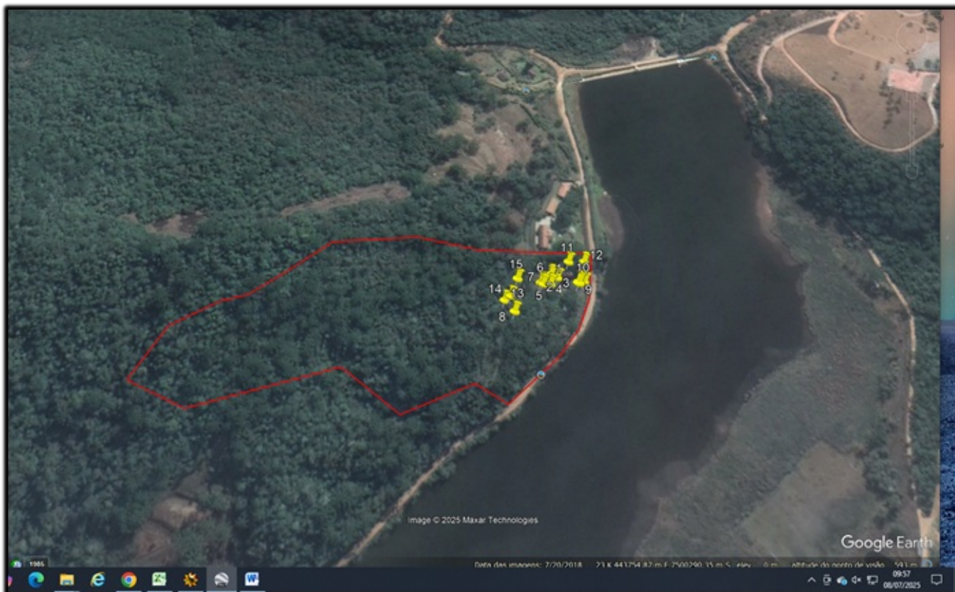
Figura 02: Limites do imóvel apresentado (vermelho) e localização dos espécimes requeridos confirmando a localização dos mesmos em área de fragmento de vegetação nativa.